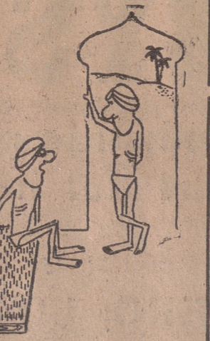
—Esta noche no he pegado un ojo. Falaba una púa en la cama.