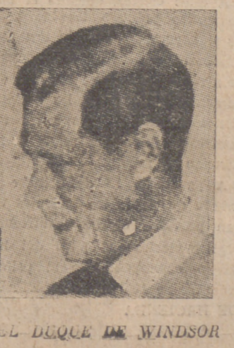
EL DUQUE DE WINDSOR

Buenos Aires, 1.—Ricardo Balbín, el candidato presidencial y uno de los más significados dirigentes del partido radical del pueblo, ha predicho que su partido ganará las elecciones presidenciales del próximo mes de febrero. Por otra parte, Balbín dijo que le agradaría ver que los votos en blanco de las elecciones del domingo se agruparan en un nuevo partido que luchara por la victoria.—Efe.