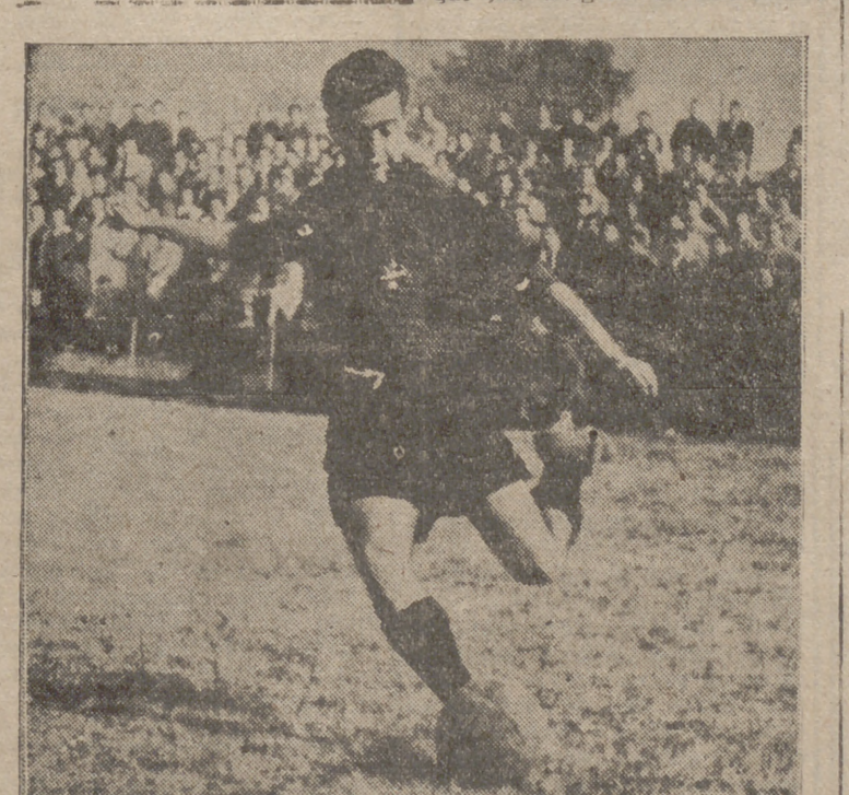
El personalidad e inconfundible estilo de Baticón que plasmando en esta preciosa estampa, que corresponde a una actuación del vallisoletano vistiendo la clásica rojinegra del Arenas zaragozano.

Londres, 28.—Un lanzador de jabalina, competidor en los campeonatos para «juniors», organizados por la Asociación Atlética Amateur, clavó la jabalina junto al corazón de uno de los jueces que presenciaba los lanzamientos. El juez de la prueba, Stan Cox, excampeón olímpico de carreras, fue llevado inmediatamente al hospital, donde calificaron su estado de grave. Los oficiales del torneo se negaron a facilitar el nombre del atleta que lanzó la jabalina.—Afil.