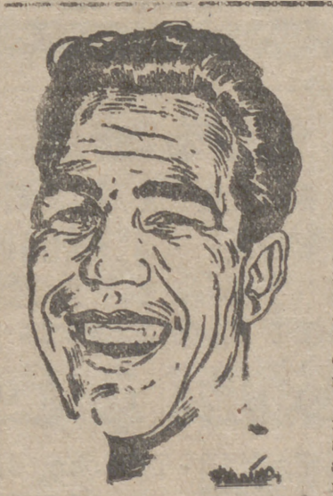
El personalidad e inconfundible estilo de Baticón que plasmando en esta preciosa estampa, que corresponde a una actuación del vallisoletano vistiendo la clásica rojinegra del Arenas zaragozano.