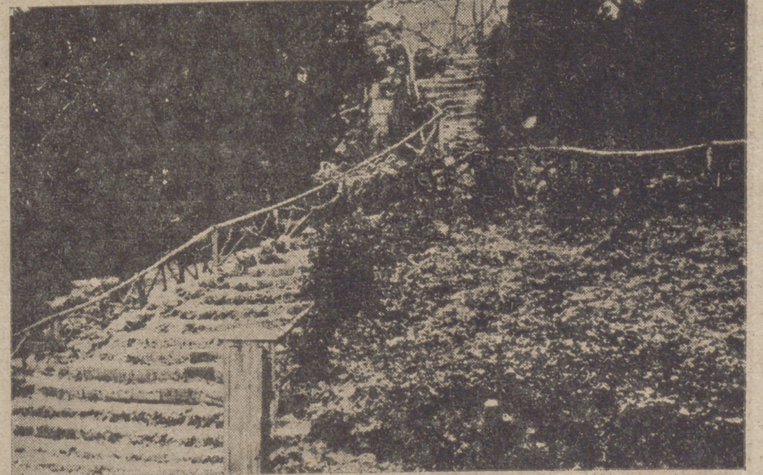
La nieve suele tener sus caprichos de estructura. En vez de aparecer, como es costumbre, exponiendo a un paisaje cubierto de blanca sábana, que indica tonalidades de tristeza, se nos presenta en esta foto, tomada en el Campo Grande, como el preludio de una estación primavera, donde comienzan a florecer alegres margaritas. Si no fuera la blancura de los escalones—que también, con un poco de imaginación, pueden suponerse flores capariscas—podría decirse habíamos llegado a la estación de los poetas.