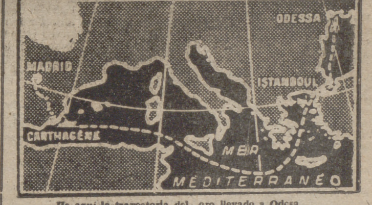
He aquí la trayectoria del oro llevado a Odesa.

Washington, 18.—Se ha llegado a un acuerdo para que Tito visite los Estados Unidos a fines del próximo mes de abril, según dicen los círculos diplomáticos de esta capital.