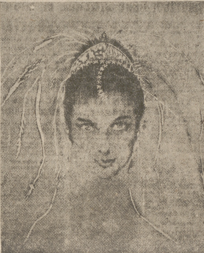
He aquí el vestido de tul y el peinado que llevaba la princesa Elena de Francia durante su boda en la Capilla Real de Dreux. Deslumbrante lijera, cuyo peinado iba adornado con tulipanes y flores de naranjo, coronado todo ello por una diadema de familia enlazada en diamantes y zafiros, rematada por una flor de lis.

Aumento de sueldo a los médicos y demás personal sanitario del Seguro de Accidentes de Trabajo El plus especial del 20 por 100 se fija en el 50 Se incrementan en un 30 por 100 los honorarios mínimos del servicio concertado