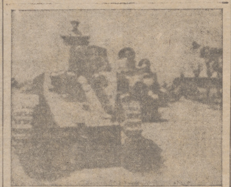
Estos son los tanques de la Marina japonesa, que avanzan a lo largo de los caminos kilométricos en busca del enemigo

Añadió que los aviones japoneses lanzaron una gran cortina de humo, al amparo de la cual se acercaron los transportes nipones, y comenzaron el desembarco alumbrados con bengalas. Las tropas tomaban tierra en grupos de 30 a 40 hombres, que al principio eran diezmos o aniquilados por el fuego de las unidades norteamericanas, pero que ante la llegada de continuos refuerzos japoneses lograron las tropas desembarcadas hacerse fuertes en las colinas que rodean la playa y obligaron después a las fuerzas norteamericanas a retroceder a las montañas.—Efe.