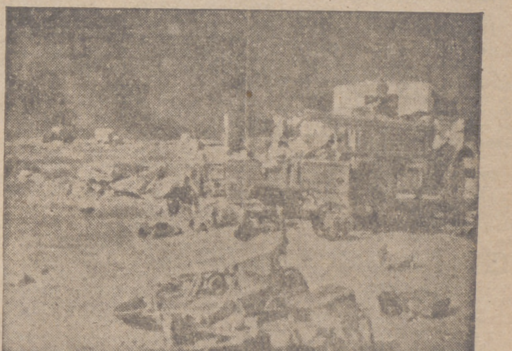
Material inglés abandonado en Africa

Melburne, 30.—Curtin, presidente del Gobierno australiano, ha recibido un mensaje de Churchill, que se considera como importantísimo. La Prensa local da cuenta de que el referido mensaje informa al ministro australiano de los acuerdos adoptados por el primer ministro británico y el presidente Roosevelt y destinados a asegurar la independencia de Australia.—Efe.