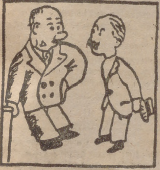
—¿Y qué sueldo quiere ganar en el Banco?— Según: el me ponen de director, tres mil pesetas; pero si me ponen de cajero, nada.