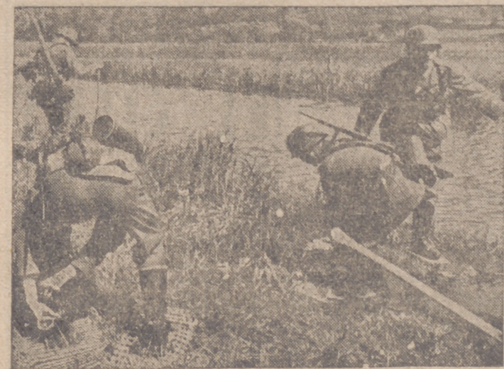
Soldados alemanes calzados de raquetas para atravesar los pantanos

Berlin, 9.—En las proximidades de las Islas Feroe, los bombarderos de gran radio de acción han hundido dos barcos mercantes de 2.500 toneladas cada uno, así como dos transportes de 800 toneladas cada uno.—Efe.