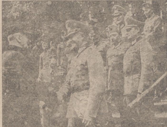
El Admiral von Horthy visita al Alto Mando del Ejército alemán

Los comentarios de actualidad se centran alrededor de la gigantesca ofensiva alemana ya anunciada por Hitler en su discurso del día 1. Esta ofensiva, que por aquella fecha contaba ya con cuarenta y ocho horas de desarrollo, se encuentra ahora en pleno apogeo. Como violenta respuesta a los esfuerzos de Timochenko en la región norte de Bryansk, las fuerzas alemanas han consumado a estas horas una formidable maniobra de cerco y aniquilamiento que se des-