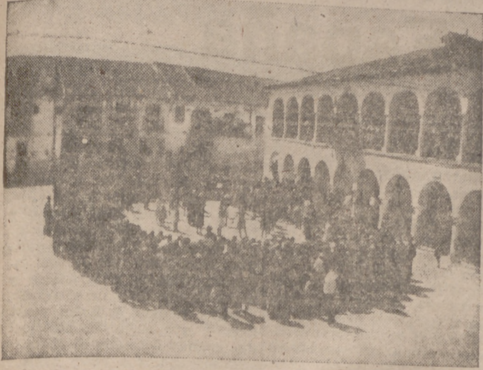
Ante los arcos de estilo románico del Ayuntamiento, la juventud baila la típica "rueda" con numerosa concurrencia de público