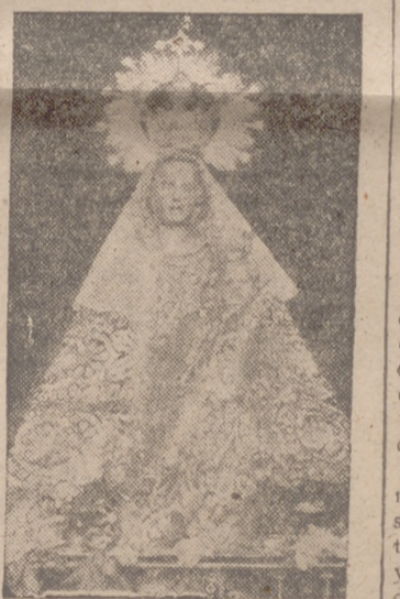
Nuestra Señora de los Mártires, Patrona de la villa e imagen milenaria de gran veneración

MAÑANA PUBLICAREMOS OTRA PAGINA DEDICADA A ISCAR, EN LA QUE INCLUIREMOS LA RESTANTE PUBLICIDAD