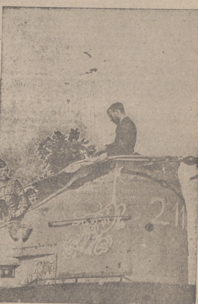
Un héroe del mar.—El capitán Eudrass, que fué laureado por Hitler con motivo del hundimiento de doscientas mil toneladas de buques ingleses, vuelve de un crucero por el Atlántico