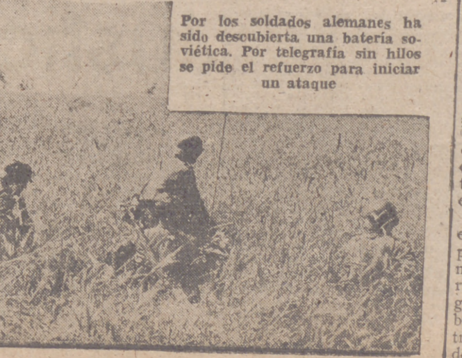
Por los soldados alemanes ha sido descubierta una batería soviética. Por telegrafía sin hilos se pide el refuerzo para iniciar un ataque

El Duce expresó al general Ambrosio su viva satisfacción y le dió instrucciones sobre el carácter de la recuperación, que tiene por fin terminar con los disturbios y organizar el retorno de las poblaciones a la vida normal, así como garantizar de modo absoluto mientras dure la guerra el que la seguridad italiana en el Adriático y su "hinterland" no se vea perturbada por los enemigos de Italia o sus agentes, bien sean éstos anglo-sajones, judíos o bolcheviques.—Efe.