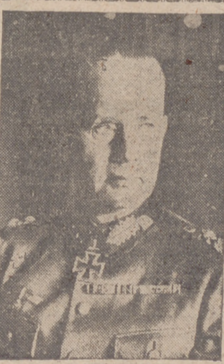
El mariscal Reichman, jefe del Grupo del Ejército alemán que conquistó Kiev

Berlín, 25.—Las tropas alemanas han cercado el 23 de septiembre, en el sector Sur del frente del Este, a nuevas formaciones de tropas soviéticas, según se comunica oficialmente. Dos divisiones bolcheviques trataron el día 24 de evadirse del sector cercado, pero todos sus intentos fueron rechazados y los bolcheviques sufrieron graves pérdidas, causadas por las vanguardias de una división alemana de Infantería. Las tropas alemanas han capturado muchos prisioneros: En el sector que ocupa una división alemana en la bolsa del Este de Kiev, una formación de combate soviética ha sido completamente aniquilada el 24 de septiembre, en combates cuerpo a cuerpo. Esta división alemana ha capturado más de mil camiones soviéticos y numerosos cañones.—Efe.