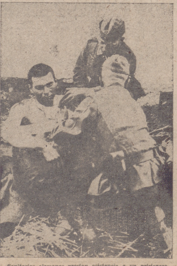
Sanitarios alemanes prestan asistencia a un prisionero soviético herido

Washington, 25.—Tres altos funcionarios del Departamento de Estado se encuentran en viaje hacia el África ecuatorial francesa, gobernada por De Gaulle. Según se informa en los círculos oficiales la misión de estos delegados es realizar una investigación "sobre las posibilidades económicas y las comunicaciones de dicha colonia".—Efe.