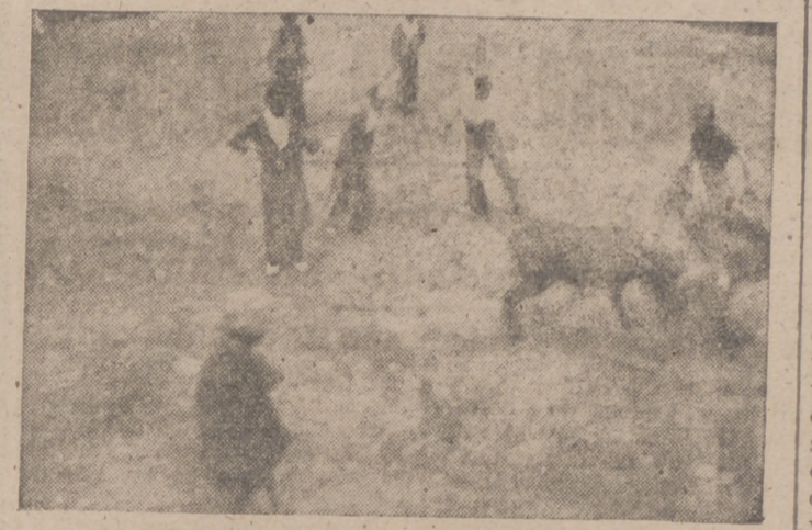
Un momento de las tradicionales "vaquillas" en la Plaza Grande de Iscar.