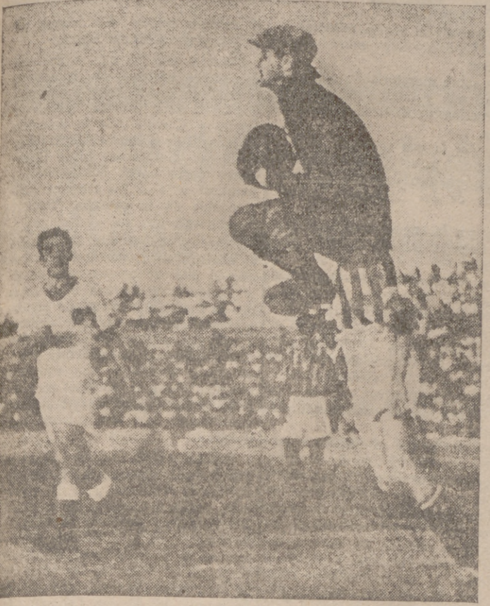
Una buena parada del portero del Castellón en el partido jugado el domingo en Valencia