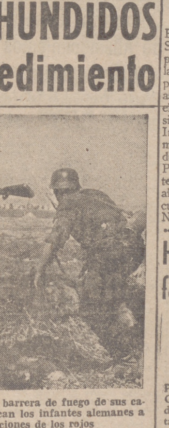
Protegidos por la barrera de fuego de sus camaradas, se acercan los infantes alemanes a las posiciones de los rojos.

Bangkok, 3.—El primer ministro, Pibul Sangram, que ocupa el puesto de comandante en jefe del ejército tailandés, ha sido nombrado jefe superior de la Aviación y de la Marina con carácter "especial".—Efe.