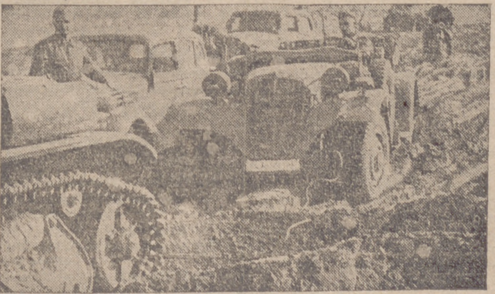
Polvo y barro, esto son las rutas en la URSS por las cuales tiene que avanzar el Ejército alemán

Berlín, 22.—El Gobierno del Reich ha entregado sus pasaportes al representante diplomático de Bolivia en Berlín, quien deberá abandonar Alemania en un plazo de 72 horas, como represalia por la expulsión del ministro alemán en La Paz. La notificación correspondiente ha sido entregada por este último al ministro boliviano de Relaciones Exteriores, y dice así: "El Gobierno de Bolivia me comunicó el 15 del actual que no me consideraba como persona grata y deseaba mi salida del país. A este efecto me señaló un plazo, que expira hoy. No se dió ninguna razón para justificar esta actitud y ni el Gobierno del Reich ni yo sabemos a qué puede obedecer. La explicación dada a la Prensa basta por sí misma para definirse como una invención sin fundamento y no responde al menor hecho real. En nombre de mi Gobierno protesto energicamente contra esta actitud, contraria a todas las reglas que rigen las relaciones internacionales, y pongo en conocimiento de las autoridades competentes que el Gobierno del Reich se ha visto obligado a no reconocer como persona grata al encargado de Negocios de Bolivia en Berlín, el cual deberá salir de Alemania en el término de tres días."