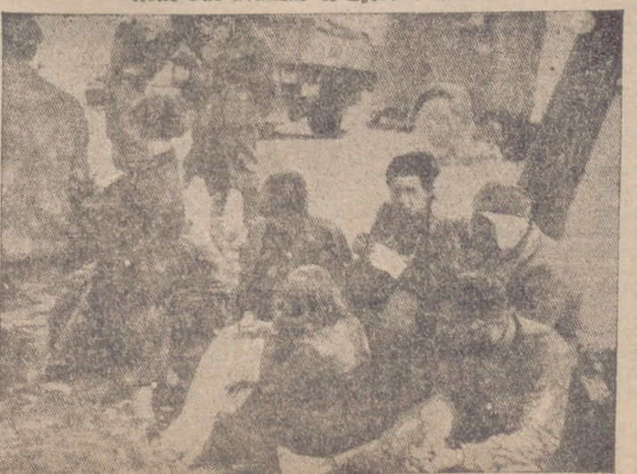
Aspecto miserable de prisioneros rusos