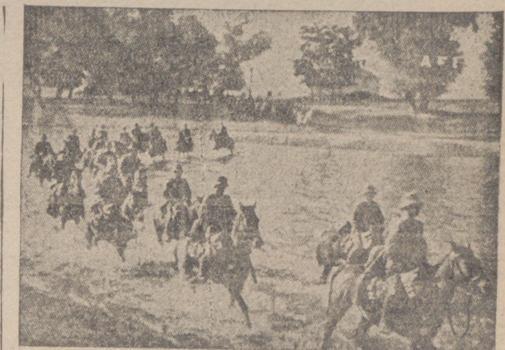
La caballería alemana atravesando el Duna

Cinco horas duró la alarma por el bombardeo de Moscú Berna, 22.—Desde Moscú se reciben noticias sobre el bombardeo aéreo de que fué objeto la capital soviética durante la pasada noche. La alarma duró desde las 22 horas hasta las tres y media de la madrugada. Numerosas casas fueron destruidas y el número de víctimas es elevado. Otras noticias dicen que los combates son muy encarnizados, especialmente en el ala derecha alemana del sector del Sudoeste, donde las tropas del general Budienny han comenzado a repliegarse.—Efe.