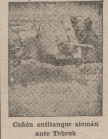
Cañón antitanque alemán ante Tobruk

Berlin, 22.—Un submarino alemán ha hundido a otro soviético en el Mar Báltico. La rapidez de la acción del navío germanico no dio tiempo a la unidad soviética de hacer uso de sus armas.—Efe.