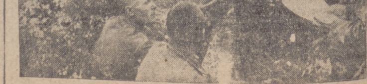
Un oficial intérprete alemán tomando declaración a un grupo de soldados soviéticos

Nueva York, 22.—Noticias de Washington transmitidas por la United Press dan cuenta de que en los medios oficiales se ha declarado que los Estados Unidos han efectuado un intento de mediación entre Chang-Kai-Chek y el ejército comunista chino, con el fin de evitar una guerra civil. De esta labor se ha encargado principalmente Owen Lattimore, enviado político de Roosevelt y consejero oficial de Chang-Kai-Chek. Parece que Lattimore ha recibido el encargo de encontrar a toda costa el medio de evitar que se produzcan combates entre los dos bandos de fuerzas dependientes de Chung-King.—Efe.