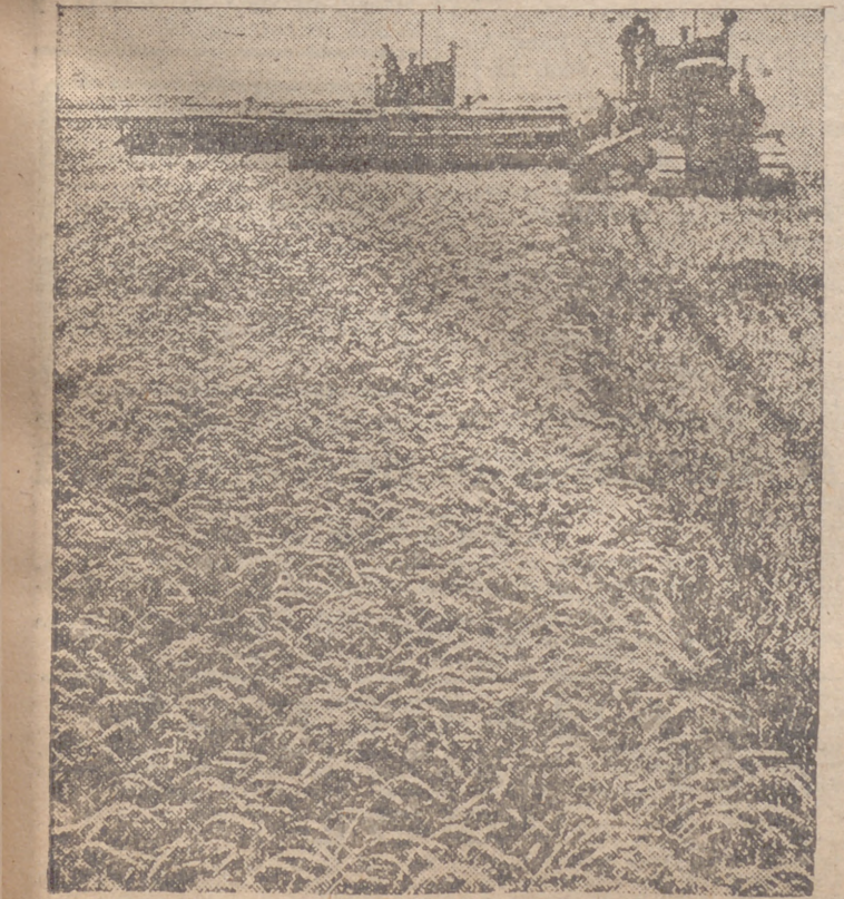
Trigales en Ucrania. La consigna stalinista es de quemarlos, pero los alemanes, posiblemente, lleguen antes que los incendiarios