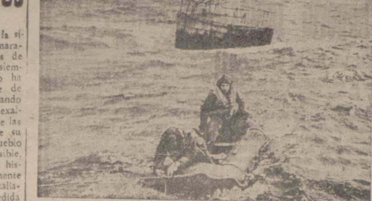
En numerosos lugares del Canal de la Mancha hay instaladas boyas de salvamento, dotadas de todo lo necesario para un naufrago. Estos puestos marinos de la Cruz Roja alemana, que tantas vidas de aviadores obligados a amarar solas, lo mismo acoge amigos que enemigos.

En franca recuperación de sus filas del entusiasmo con de Avilhera 26, se apuntó en su favor una nueva victoria y con ello la sorpresa de la Jornada al vencer en el Estadio Municipal el pasado sábado al equipo de Automovilismo C. E. C., uno de los favoritos de este torneo, por el tanteo de 2 a 1.