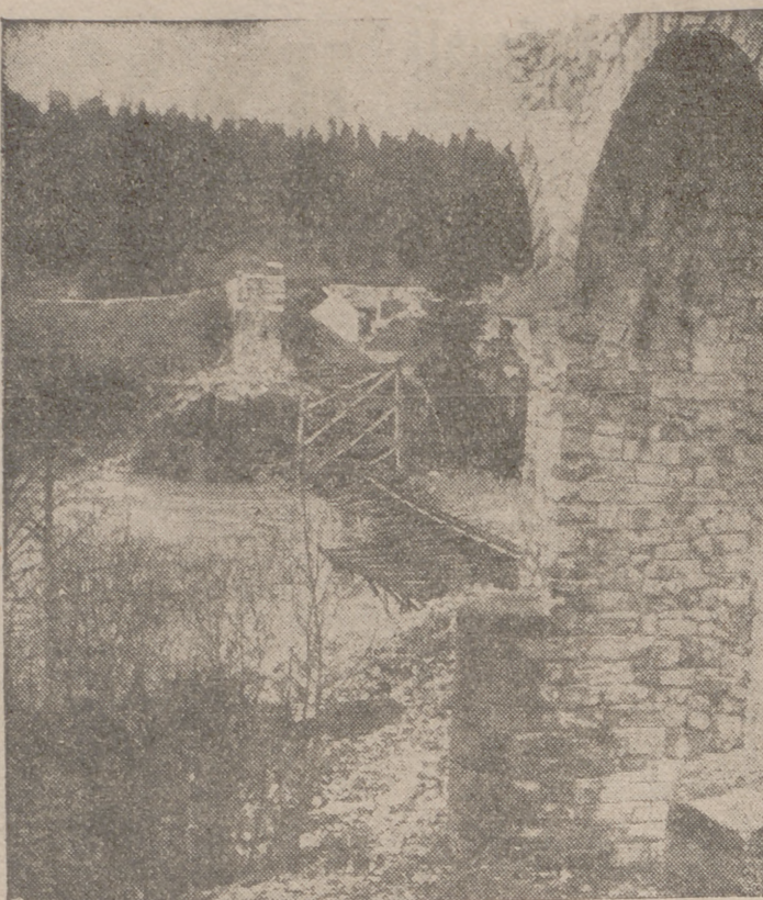
En Yugoslavia, como antes en muchas otras partes, el enemigo destruyó los puentes de su país, sin poder retardar ni un minuto el victorioso avance de las tropas alemanas

La frase del Kaiser "Inglaterra pierde todas las batallas menos la última" vive en sus cerebros insaciables. Sólo hay una Inglaterra, la de Andalsnes y Dunquerque, la de Salónica y el Pireo. Las ruinas de tantos pueblos dan bien clara una definición.