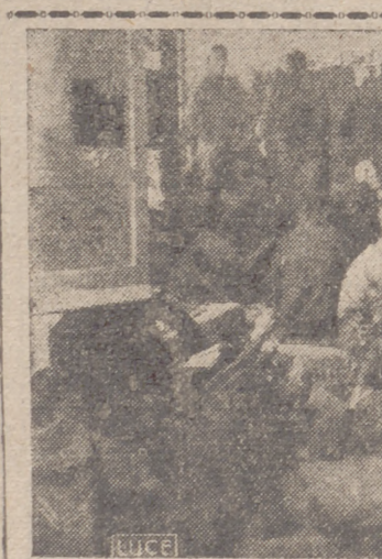
Prisioneros ingleses capturados durante la reconquista de Cirenaica

Roma, 7.—Las tropas inglesas han ocupado el fuerte de Rutba, situado en las proximidades de la frontera entre el Irak y Transjordania, según noticias procedentes del Irak.—Efe.