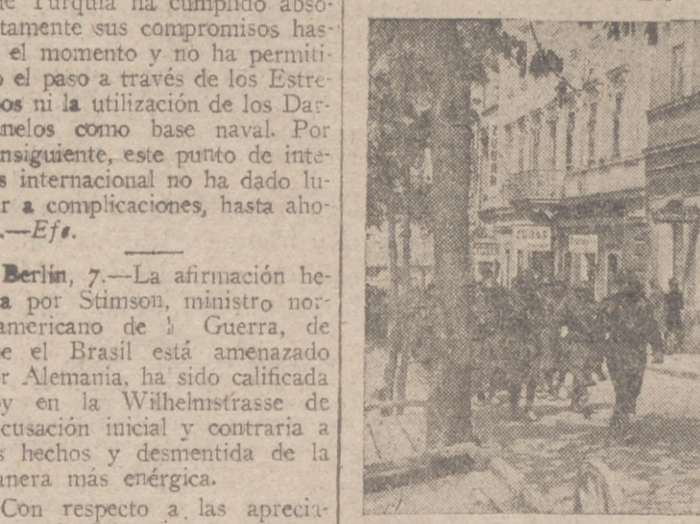
Tropas italianas atraviesan la ciudad de Sussak.