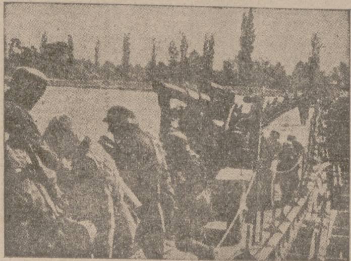
La artillería alemana pasando por un puente sobre el Danubio

Días vendrán en que esta lucha que empieza encuentre en el "nuevo orden mundial" el reconocimiento merecido.