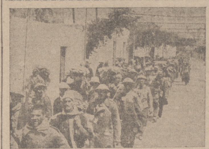
Una columna de prisioneros ingleses, en el frente de Africa del Norte

Tokio, 25.—Las dificultades políticas con que tropieza el Gobierno australiano van en aumento, según comunican de Sidney. La Agencia Domei afirma que el partido laborista ha provocado una escisión en la mayoría parlamentaria, y los jefes obreros han rechazado toda participación en el Gabinete. Los acontecimientos militares de Grecia han contribuido a acentuar las críticas dirigidas contra los ministros.—Efe.