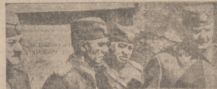
Generales serbios prisioneros de los alemanes

Atenas, 25.—El comunicado del Ministerio de Seguridad Pública griego anuncia ataques aéreos alemanes contra las regiones del Pireo, Eginax, Eulestia, Magara y Corinto. El comunicado señala algunas víctimas y daños; así como bombardeos de varios barcos. Añade que la D. J. A. griega derribó tres aviones alemanes.—Efe.