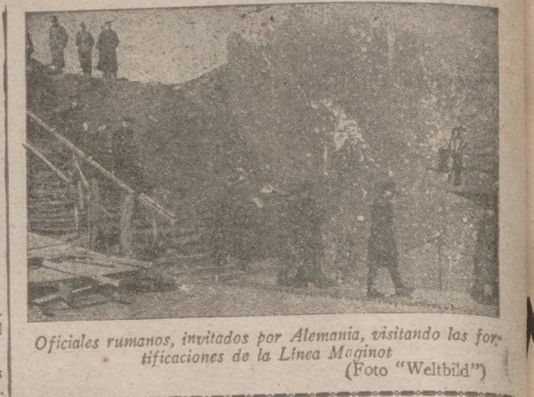
Oficiales rumanos, invitados por Alemania, visitando las fortificaciones de la Línea Maginot

Una segunda serie del último Libro Blanco alemán Berlín, 8.—El ministro de Negocios Extranjeros del Reich prepara la publicación de una segunda serie de documentos del Libro Blanco número 7.—Efe.