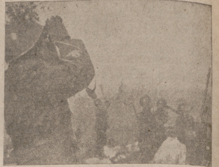
Una posición de artillería anti-aérea italiana en el frente greco-albanés

Valencia, 18.—El día 20 comenzarán las tiradas en la Real Sociedad de Tiro de Pichón, con motivo de las fiestas e inauguración del chalet construido recientemente. Prometió su asistencia el general Moscardó. Este concurso, seguramente el más importante que se celebra este año en España, está dotado con ochenta