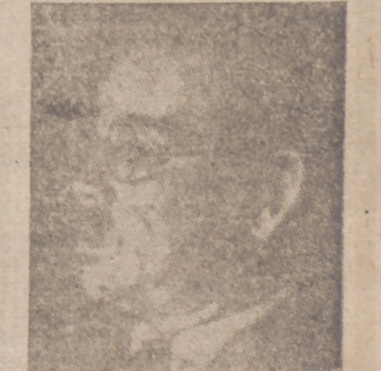
MATSUOKA, ministro de Negocios Extranjeros del Japon

Washington, 18.—Miembros del Ejército revelan que el lunes salió para Dayton (Ohio) el primero de los veintidós bombarderos destinados a R. A. F. Estos aparatos son cuádrimotora "Boeing" de gran radio de acción, y que se encontraban en el aeródromo de Washington desde su llegada de Seattle. Ese modelo de aviones será enviado a Inglaterra al ritmo de uno diario.—Efe.