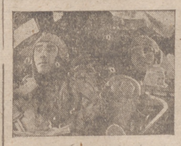
Cabina de mando de un gran bombardero alemán en pleno vuelo sobre Malta

Tokio, 18.—Después de diez horas de esfuerzos desesperados se ha logrado salvar a 108 mineros que quedaron sepultados en la catástrofe de la mina de Hokkaido. Se desean, era de poder salvar a otros 20 obreros que se encuentran aún dentro de la mina. La catástrofe fue provocada por corrientes de gas que hicieron explosión, provocando el incendio de la mina.—Efe.