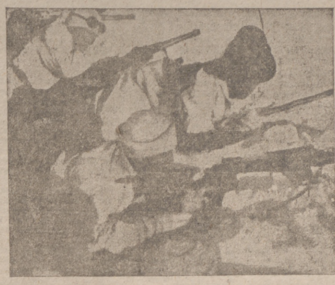
Una patrulla de soldados alpinos en el frente greco-albanés