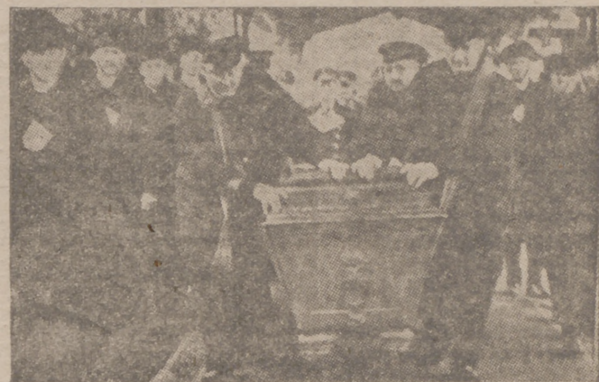
Según orden del Führer han sido trasladados a París los restos mortales del duque de Reichstadt, hijo de Napoleón I, para descansar al lado de su padre en la Catedral de los Inválidos. El sarcófago es transportado a la estación del Oeste de Viena

Nueva York, 13.—Un gran incendio ha abrasado el barrio de «Queen», de esta capital. Un centenar de inmuebles han sido ya pastos de las llamas y el fuego sigue extendiéndose. El siniestro tuvo su origen en la estación ferroviaria, y una hora después tres manzanas de casas ardían enteramente.—Efe.