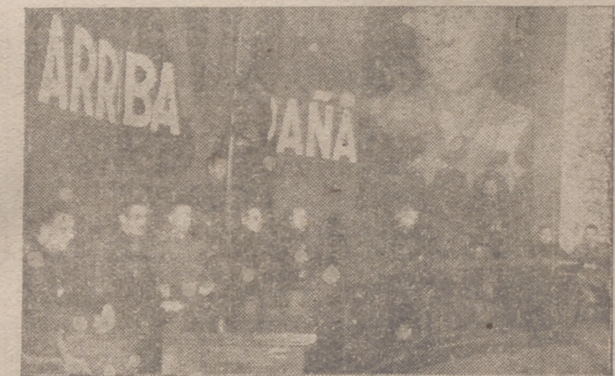
Autoridades y jerarquías presiden el acto inaugural del Consejo Provincial de la C. N. S. de Barcelona