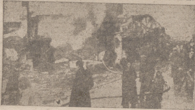
Efectos del bombardeo alemán en Coventry

Actualmente se trabaja con actividad en la instalación de una factoría, que se prepara con objeto de la pesca del bacalao, que se comenzará este año de 1941. Por otra parte se realizan con ritmo acelerado las obras finales para la habilitación del puerto