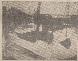
Vapores ingleses en el puerto holandés de Zeebruff, bajo la vigilancia de los alemanes

Terminó el delegado nacional de Sindicatos exhortando a los productores a trabajar con tenacidad y perseverancia, virtudes ambas que nos llevarán a la doctrina de José Antonio, ayudados por el Caudillo. ¡Arriba España! — Cifra.