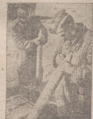
Artilleros alemanes, en la costa de la Mancha, preparando las granadas

daron deshechos bastantes cuadros de gran valor histórico y preciosos objetos del culto. El informe va acompañado de fotografías, y sus autores piden que tanto aquél como éstas sean enviadas al Vaticano.—Efe.