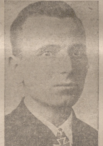
El teniente de navío alemán Kretschmar, cuyo submarino ha hundido ya más de 250.000 toneladas enemigas, entre ellas tres cruceros auxiliares y el destructor británico "Baring".

Barcelona, 9.—La delegada nacional de la Sección Femenina de F. E. T. y de las J. O. N-S, estuvo por la mañana en las oficinas de la Sección Femenina, donde despachó con las delegadas de provincias y la de Barcelona. Por la tarde continuará el despacho.—Cifra.