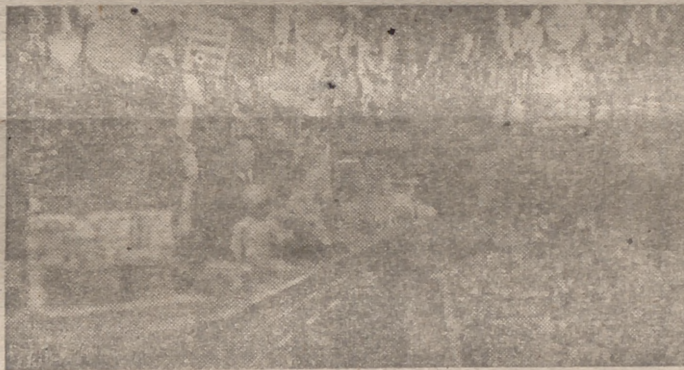
Vista parcial de una de las grandes exposiciones de juguetes en nuestra ciudad

Por otra parte el «Herakl Tribune» comunica desde la capital británica que una gran bodega de la City ha sido saqueada completamente. Estos saqueos son una de las más graves preocupaciones británicas desde que comenzaron los bombardeos nocturnos. A pesar de las graves sentencias dictadas contra los ladrones continúan los robos y saqueos.—Eje.