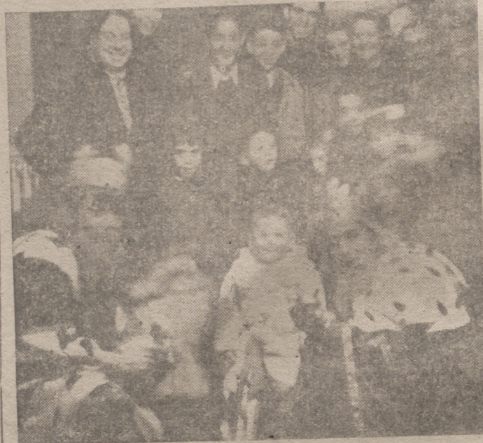
Los Reyes Magos, rodeados de niños durante el acto celebrado en el salón de actos de LIBERTAD, en que fueron obsequiados los hijos de empleados y obreros de nuestro diario

Los tres niños del cuento ahora duermen y sueñan. Y mañana, ¡qué delicioso despertar les espera! Todos verán colmados sus deseos, porque los Reyes siempre atienden las peticiones hechas en las cartas que los niños les dirigen. Y aunque no concluyamos nuestro cuento, vamos a decir por qué los Reyes, en Valladolid, pueden dar a cada uno lo que haya solicitado o lo que más necesite.