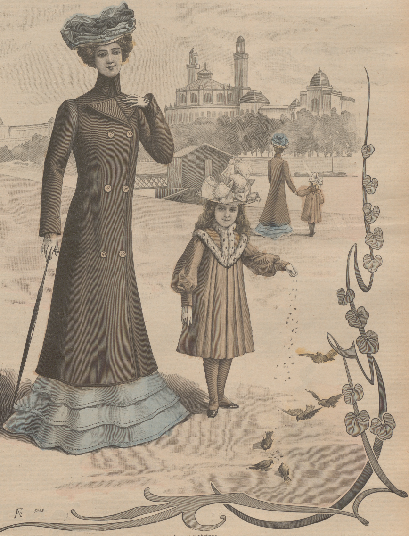
1. Elegantes sombreros y abrigos.

SUSCRIPCIÓN 6 Meses. 1 Año. En toda España. 4 pts. 7'50