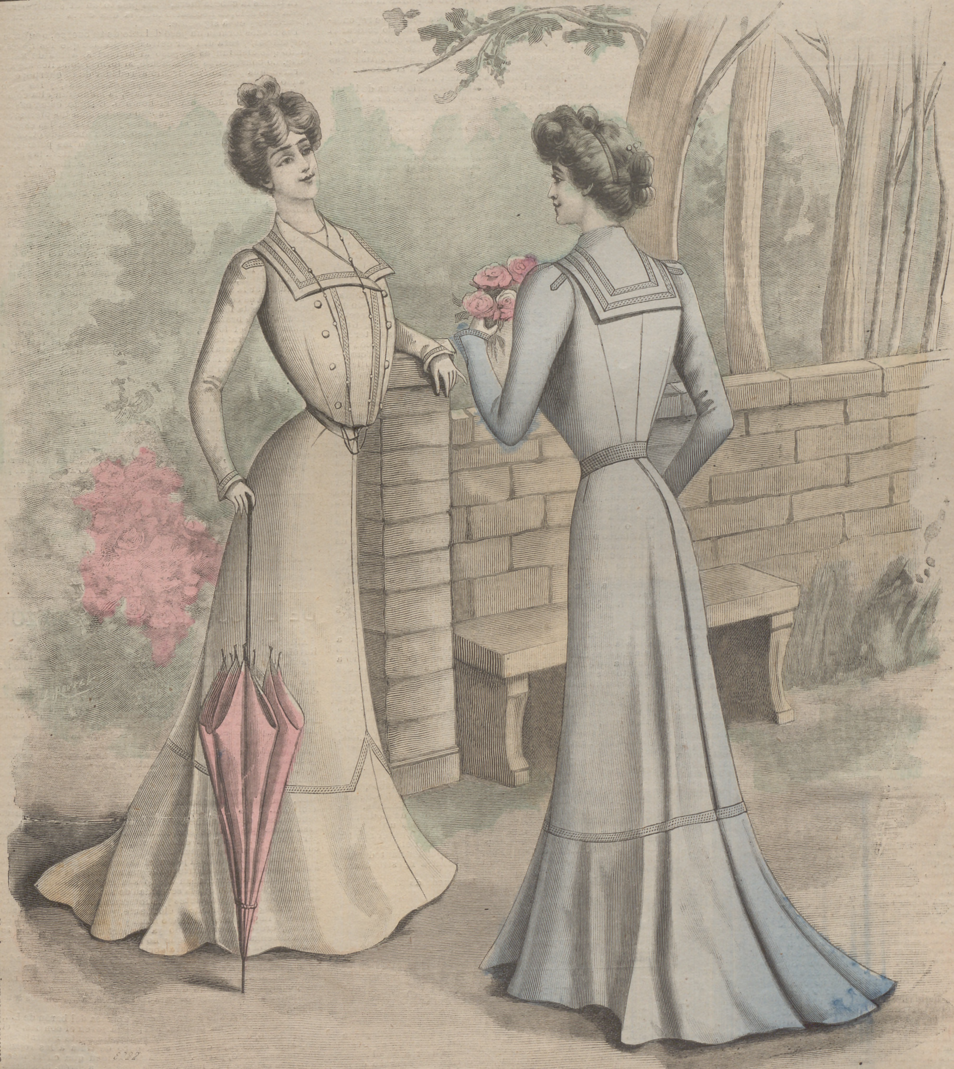
1. Toilette de verano, delantero y espalda.

SUSCRIPCIÓN 6 Meses. 1 Año. En toda España. 4 pts. 7'50