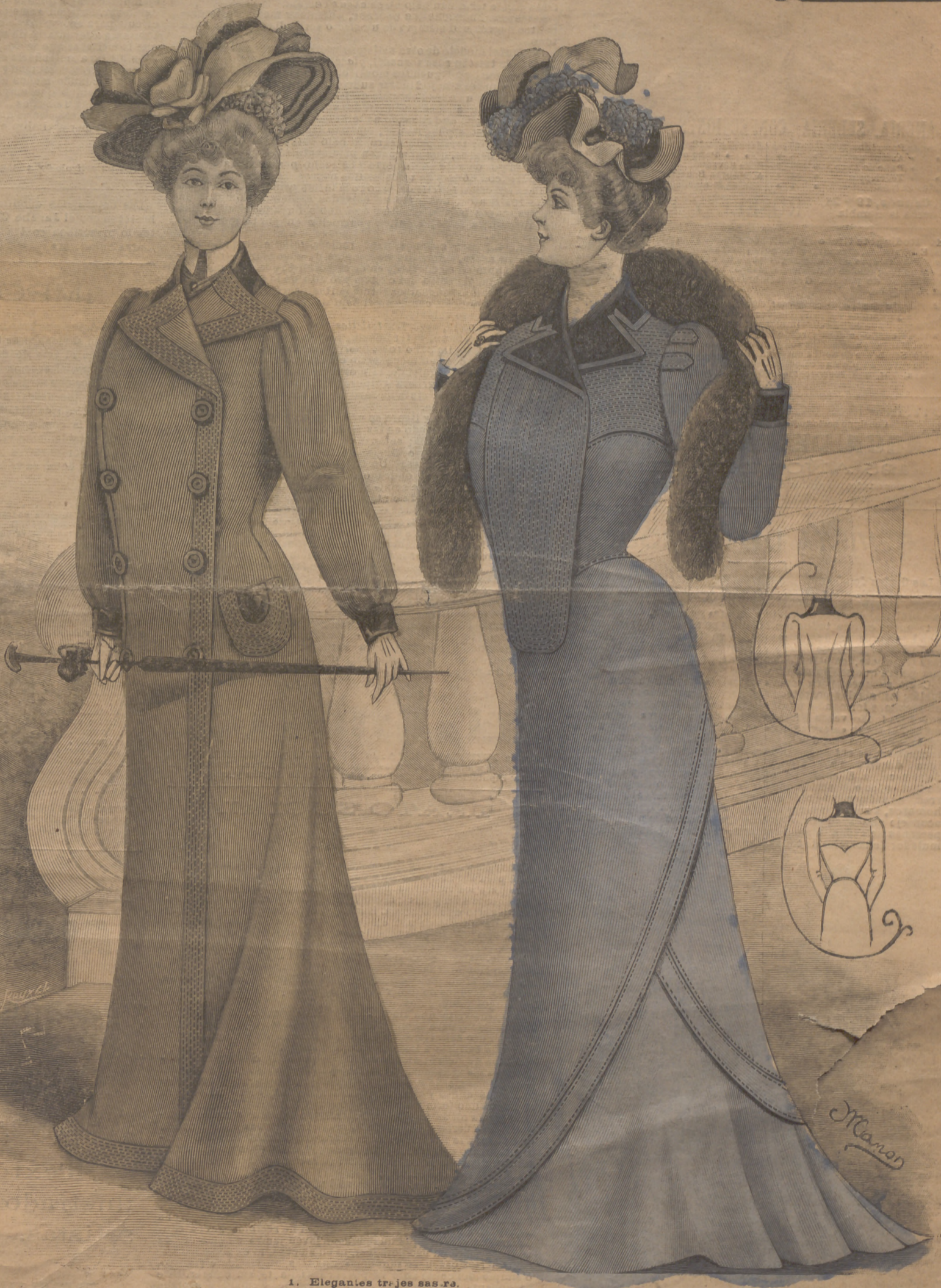
1. Elegantes trajes sarsa.

15 NÚMERO SUELTO céntimos en toda España