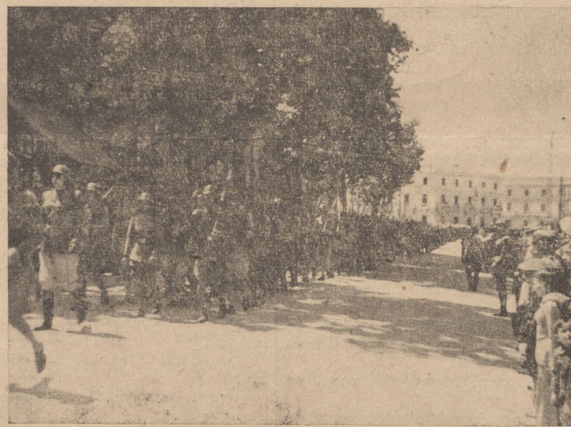
En los campos de Aviación

En aquel momento estaban las Jerarquías de Falange en los Aeródromos de nuestra capital rindiendo pruebas de amistad y camaradería sincera a los Caballeros Legionarios del Aire, no asistiendo al acto del Paseo de Sagrera.