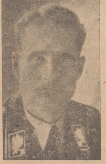
Rodolfo Hess, Representante de Hitler en el Partido Nazi