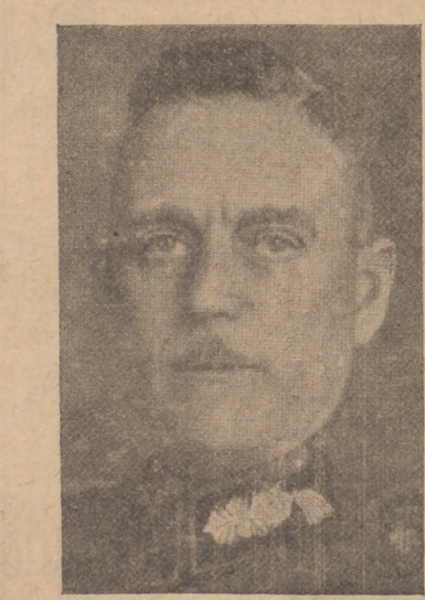
El General Keitel, Jefe de Estado Mayor alemán