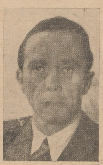
José Goebbels, Ministro de Propaganda del III Reich

de estas palabras del gobernador, el coche real siguió su camino.