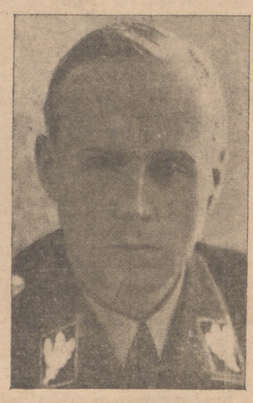
Joaquín Von Ribbentrop, Ministro de Negocios Extranjeros

Desde las primeras horas de la tarde de la calle en la que se halla instalada la Cancillería apareció llena de una enorme multitud para ver al Führer; todo el trayecto comprendido entre el Palacio y la Cancillería había sido vistosamente adornado por monumentales banderas de los dos países y daban guardia jóvenes pertenecientes a las organizaciones nazis; en la estación esperaban la llegada del Führer las mayores personalidades del Reich, destacándose varios ministros del Gobierno. Así estaba presente el Ministro de Relaciones Exteriores, Von Ribbentrop, el Lugarteniente de Hitler Hess, el Ministro de Propaganda, Goebbels y el Jefe de Prensa, Dr. Dietrich que acompañarán a Hitler en su viaje por Italia.