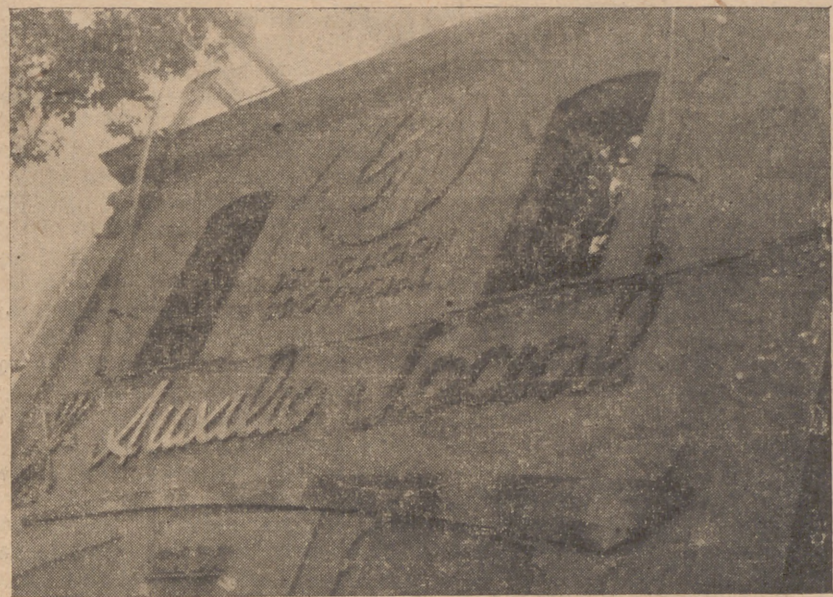
En la fachada, el nombre evocador de AUXILIO SOCIAL, sugiere al ánimo la visión de la España del Caudillo, del pan y de la justicia...

—Mallorca puede dar mucho más. Sería interminable la descripción de todas las dependencias y departamentos de «Auxilio Social». Merecen