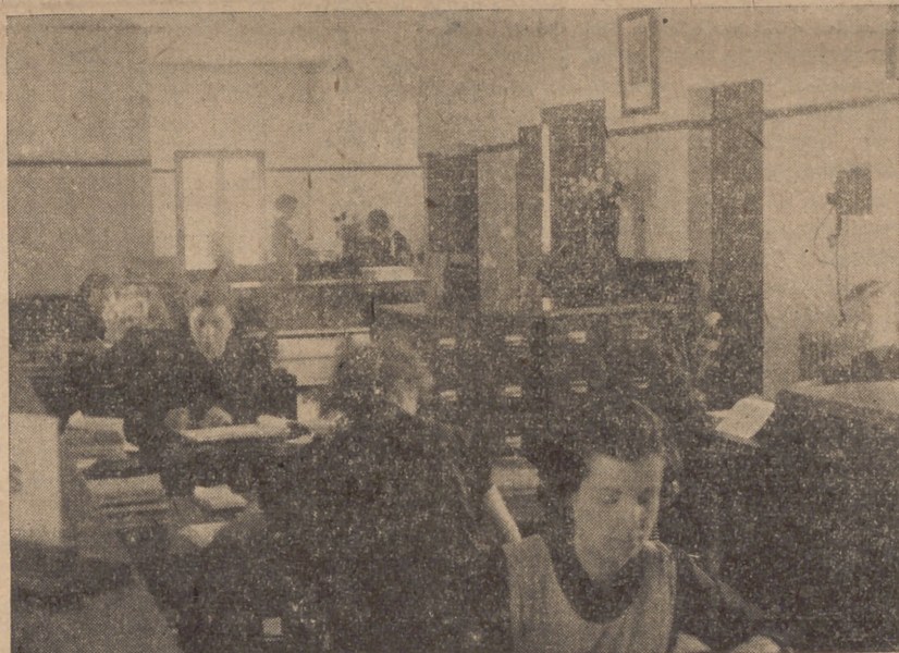
...en el interior, la labor continuada día de cómo en un acercamiento fraternal, todos los españoles serán unos bajo el cielo de la Patria.

Creemos que Mallorca hará entrega a Valencia, entre víveres y metálico de una cantidad no inferior a MEDIO MILLON DE PESETAS.