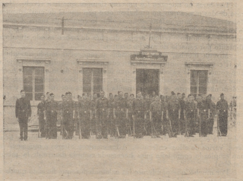
Grupo de camaradas de Falange Marítima, que tanto ha cooperado a que fuera un hecho magnífico la iniciativa de un grupo de falangistas.