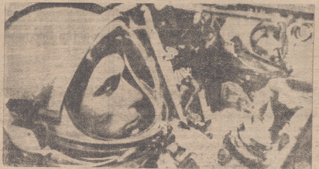
Los astronautas del "Géminis 9", Eugene Cernan y Thomas Stafford, aparecen sentados en su cápsula espacial durante el último ensayo.

La misión a efectuar es la más difícil de las intentadas hasta ahora