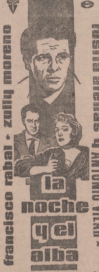
Francisco Rabal - Zully Moreno

UNA TEMATICA ACTUAL Y PROFUNDAMENTE ALECCIONADORA! UN GRAN REPARTO PARA UNA GRAN PELICULA.