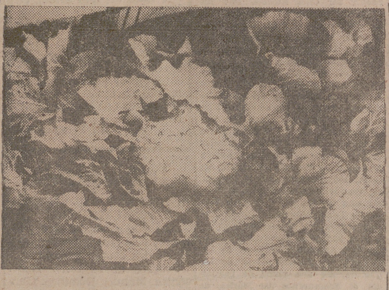
FULLENSA (Mallorca).—Gigantesco ejemplar de coliflor que ha sido recolectada por don Bernardo Pallicer en su finca de "La Torreta". Dio un peso de 17.500 kilos, es muy tierna y bien formada.