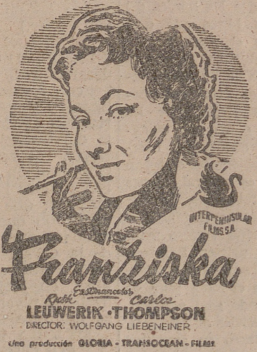
Una producción GLOIA - TRANSOCEAN - FILM

UNA PELICULA QUE REPRESENTA LA PERFECCION PRODIGIOSA DEL CINE ALEMAN