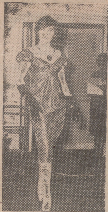
Elegante traje de cocktail, confeccionado en brocado de color rojo y bordado en oro