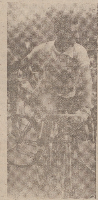
MADRID. — El gran corredor belga Van Looy, con el jersey amarillo, símbolo del líder, fotografiado en la meta instalada en el Retiro, momentos después de su victoria en la etapa Toledo-Madrid.

Poco después de la salida se produjo una escapada por parte de varios corredores belgas, que fue neutralizada, y al paso por Alcalá de Henares —28 kilómetros—, los participantes marchaban en un solo pelotón. Por Guadalajara —54 kilómetros— llegó en primer lugar a la meta volante Iturat, seguido de Marigil y Segu, y seguidamente los participantes en un solo grupo. Al paso por Alcolea del Pinar —134 kilómetros— se halla establecido el control de aprovisionamiento, pasando todos los corredores en grupo y adelantándose Van Looy a todos los demás en el momento de recoger su bolsa. Los corredores en marcha hacia Soria recuperan la mayor parte del tiempo que llevaban de retraso, y a la entrada de Soria se presentan en primer lugar Van Looy y vence en el sprint final el corredor belga sobre varios participantes.