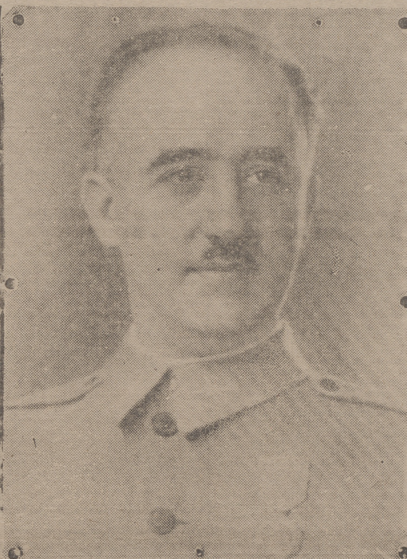
JAUDILLO FRANCO, MARAVILOSO ARTIFICE DE LA VICTORIA EN LA GUERRA Y QUE INICIA LA GRAN VICTORIA DE LA PAZ CON EL FUERO DEL TRABAJO, EL MAS TRANSCENDENTAL ACONTECIMIENTO EN LA OBRA DEL NUEVO ESTADO.

6. Se crearán las Instituciones necesarias para que en las horas libres y en los recreos de los trabajadores, tengan éstos acceso al disfrute de todos los bienes de la cultura, la alegría, la milicia, la salud y el deporte.