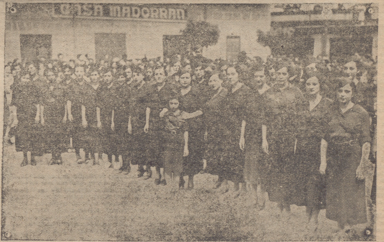
CALAHORRA. — SEÑORITAS DE FALANGE ESPAÑOLA CALAHORRANA QUE DESFILARON ANTE EL GOBERNADOR