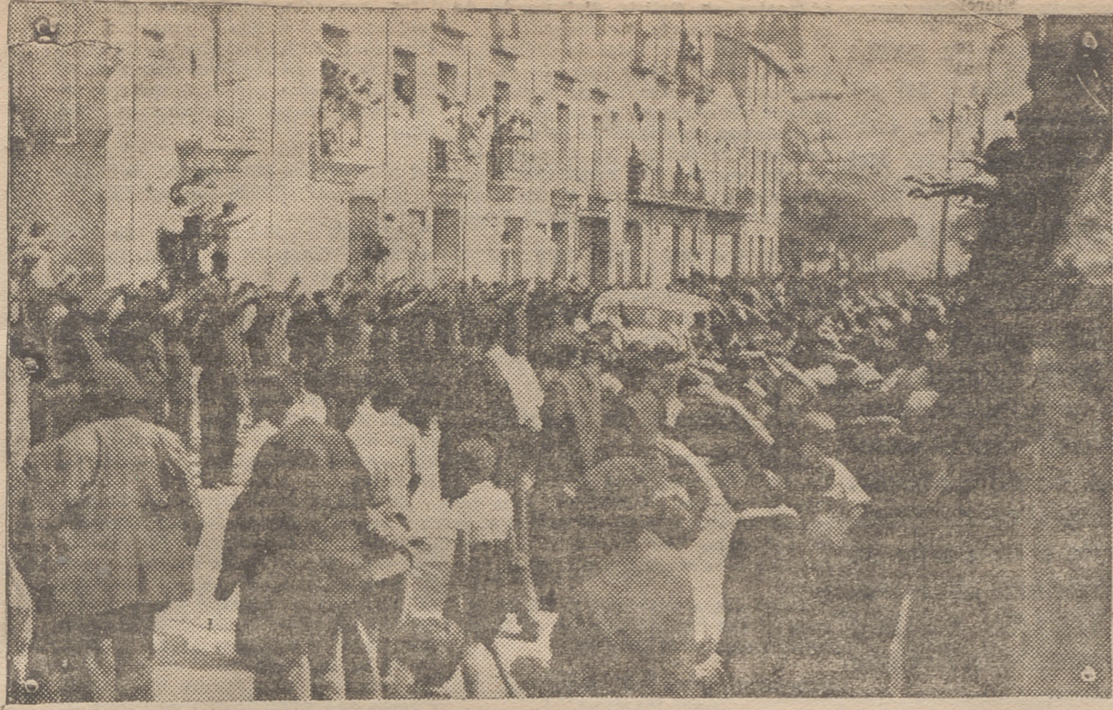
ARNEDO. — LLEGADA DEL SEÑOR GOBERNADOR CIVIL DE LA PROVINCIA