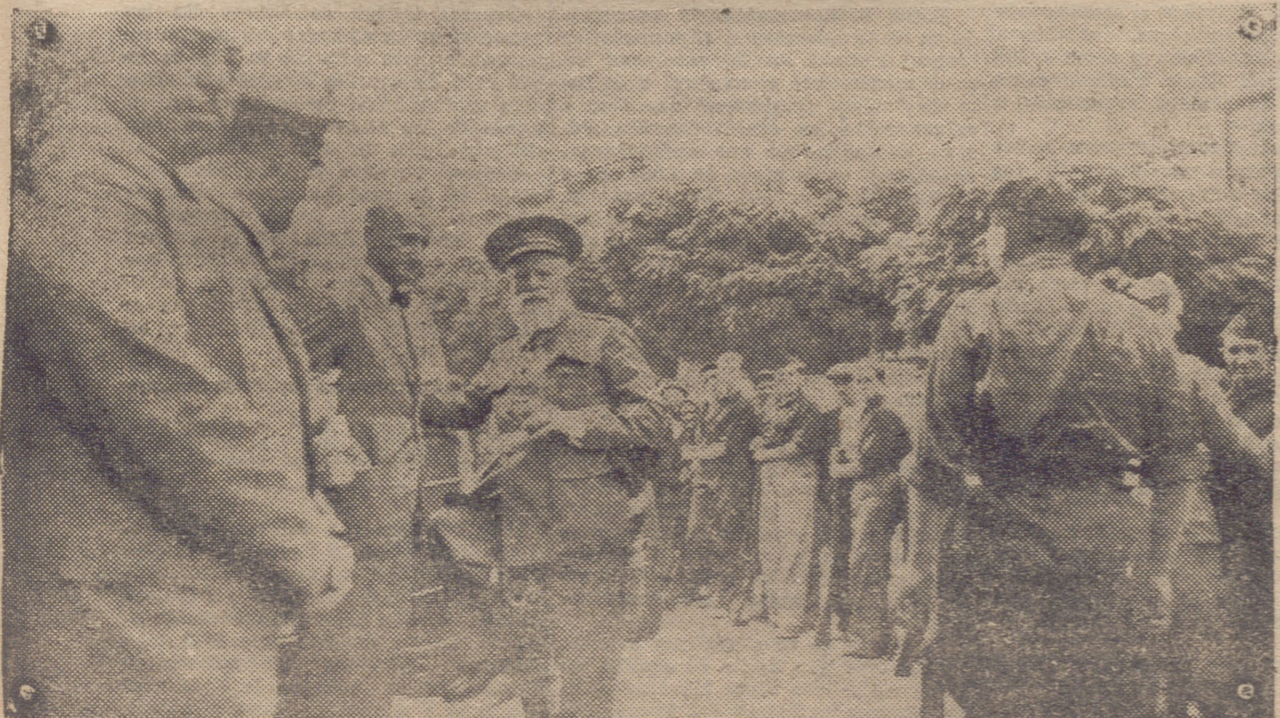
SANTO DOMINGO. — EL EXCMO. SEÑOR GENERAL CABANEZAS CONVERSANDO CON LAS AUTORIDADES