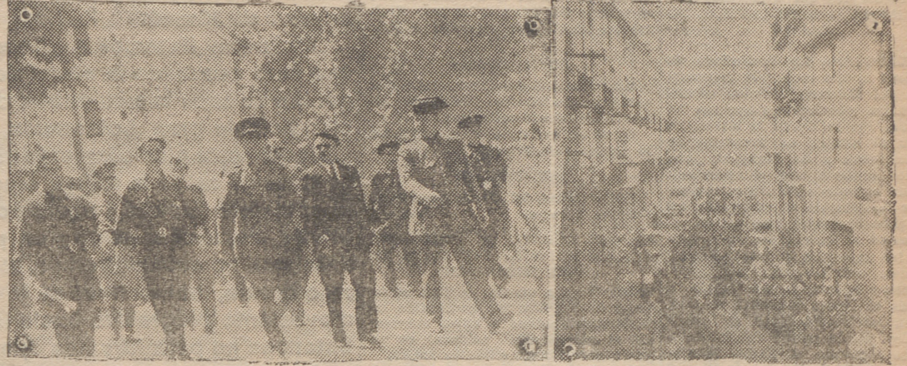
ARNEDO. — EL SEÑOR GOBERNADOR CIVIL DE LA PROVINCIA EN SU VISITA A ESTA CIUDAD, ACOMPAÑADO DE LAS AUTORIDADES LOCALES