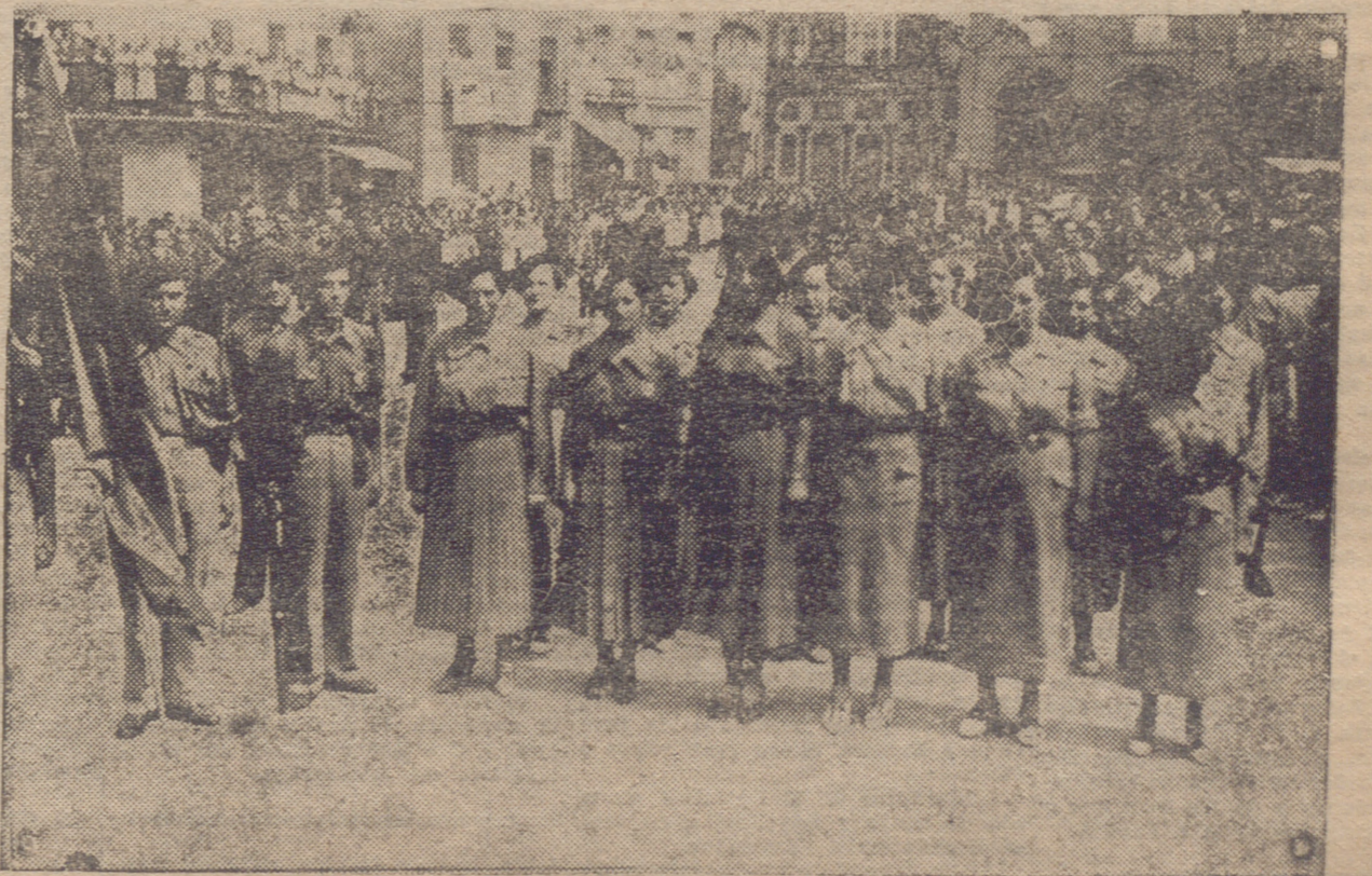
CALAHORRA. — SEÑORITAS DEL REQUETE DE CALAHORRA DESPUES DEL DESFILE ANTE EL GOBERNADOR