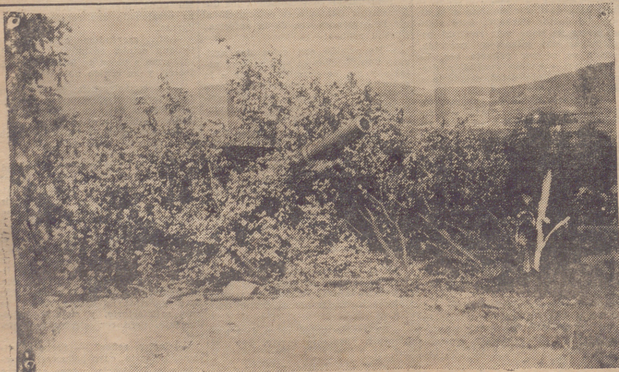
SOMOSIERRA. — UNA PIEZA DEL 12 Y MEDIO DISPUESTA A FUNCIONAR