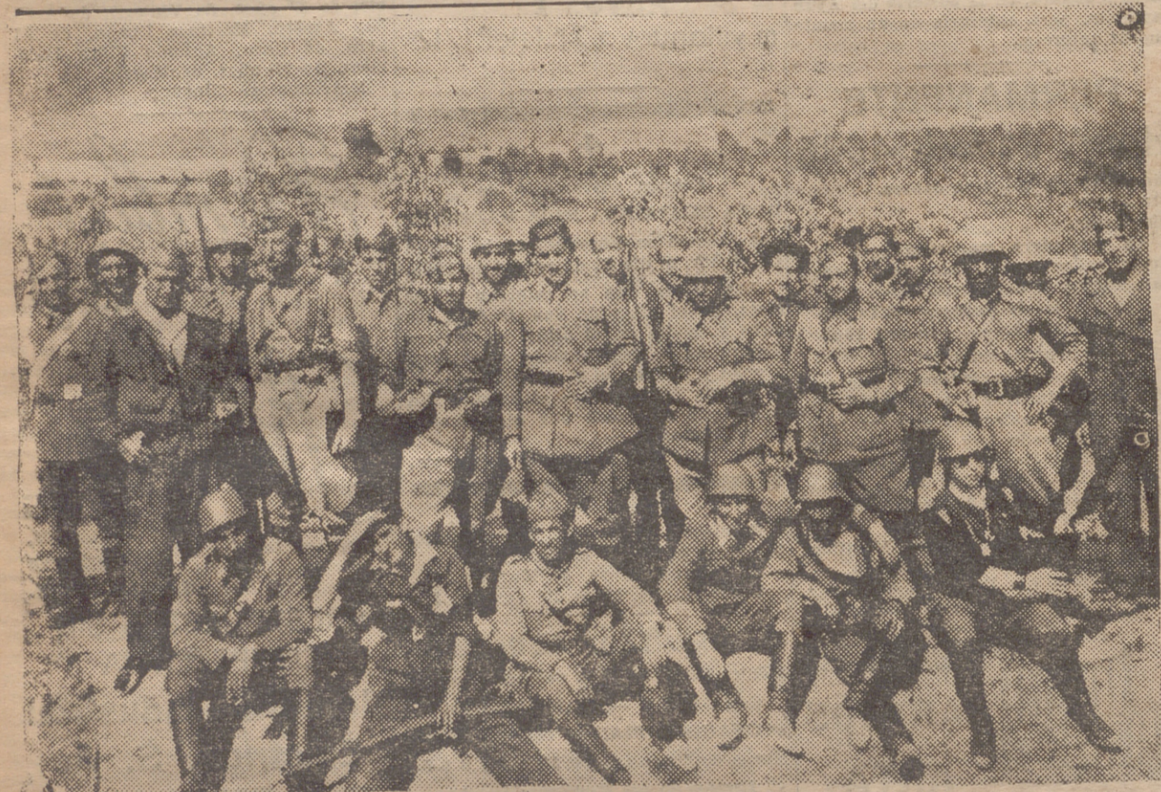
SOMOSIERRA. — ARTILLEROS DE LOGROÑO QUE BATEN A LOS "ROJOS" EN LAS AVANZADAS DE BUITRAGO