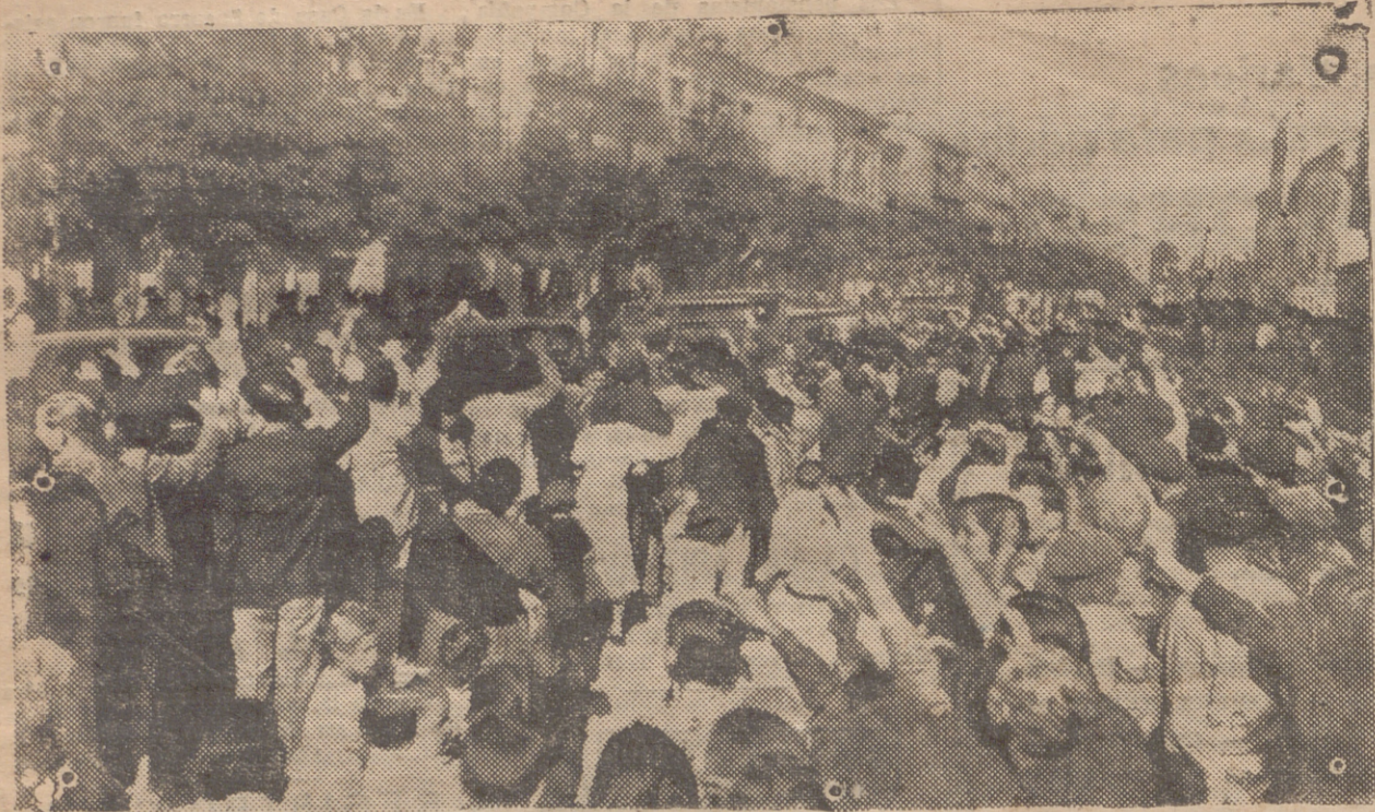
SANTO DOMINGO DE LA CALZADA. — LLEGADA DEL EXCMO. SEÑOR GOBERNADOR CIVIL A DICHA CIUDAD