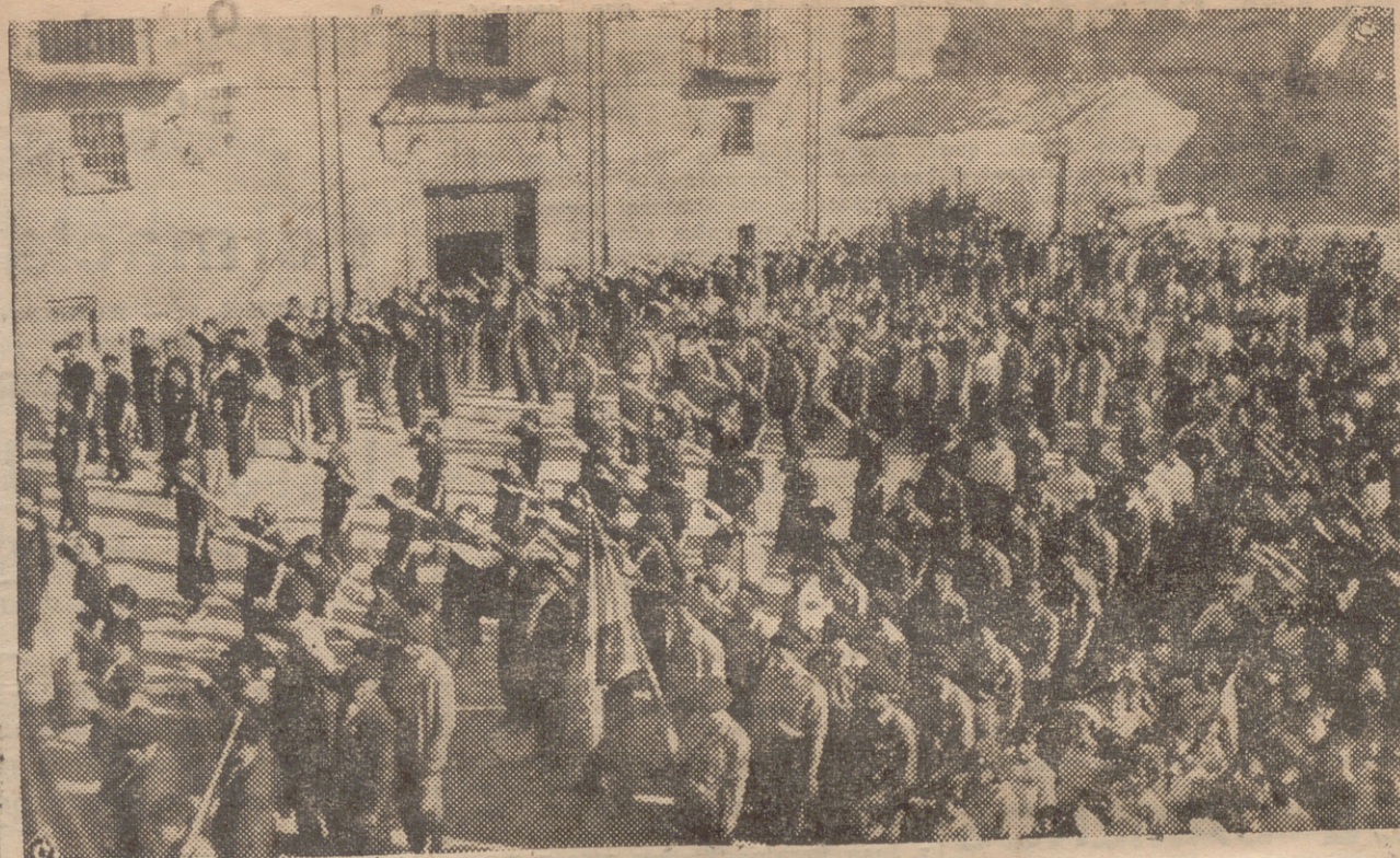
SANTO DOMINGO DE LA CALZADA. — DESFILE DE REQUETES Y FALANGISTAS FRENTE AL AYUNTAMIENTO