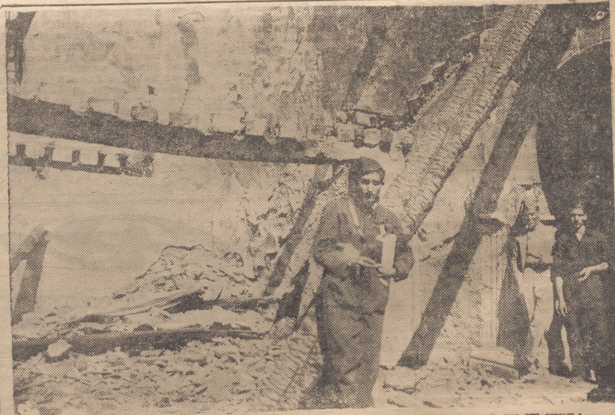
IGLESIA DEL PUEBLO DE SOMOSIERRA, INCENDIADA POR LOS MARXISTAS EN SU HUIDA