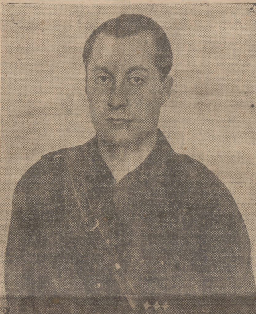
JOSE ANTONIO PRIMO DE RIVERA

Mz. de Salinas Vara de Rey, 13 Teléfono. 1675 ENFERMEDADES DEL CORAZON RAYOS X ELECTROCARDIOGRAFO