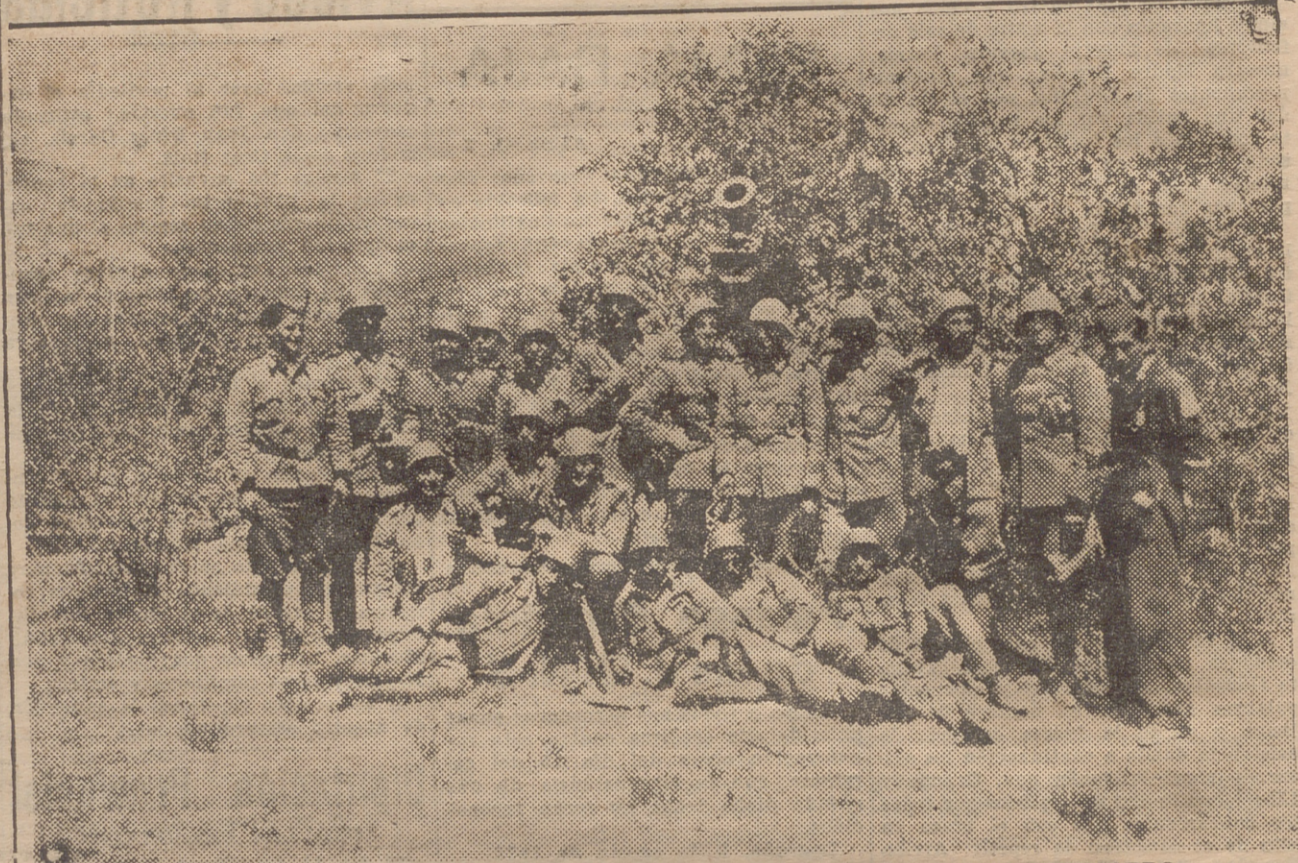
PIEZA DEL 15'5 DEL FRENTE DE SOMOSIERRA, EN EL PUEBLO DE ROBREGORDO