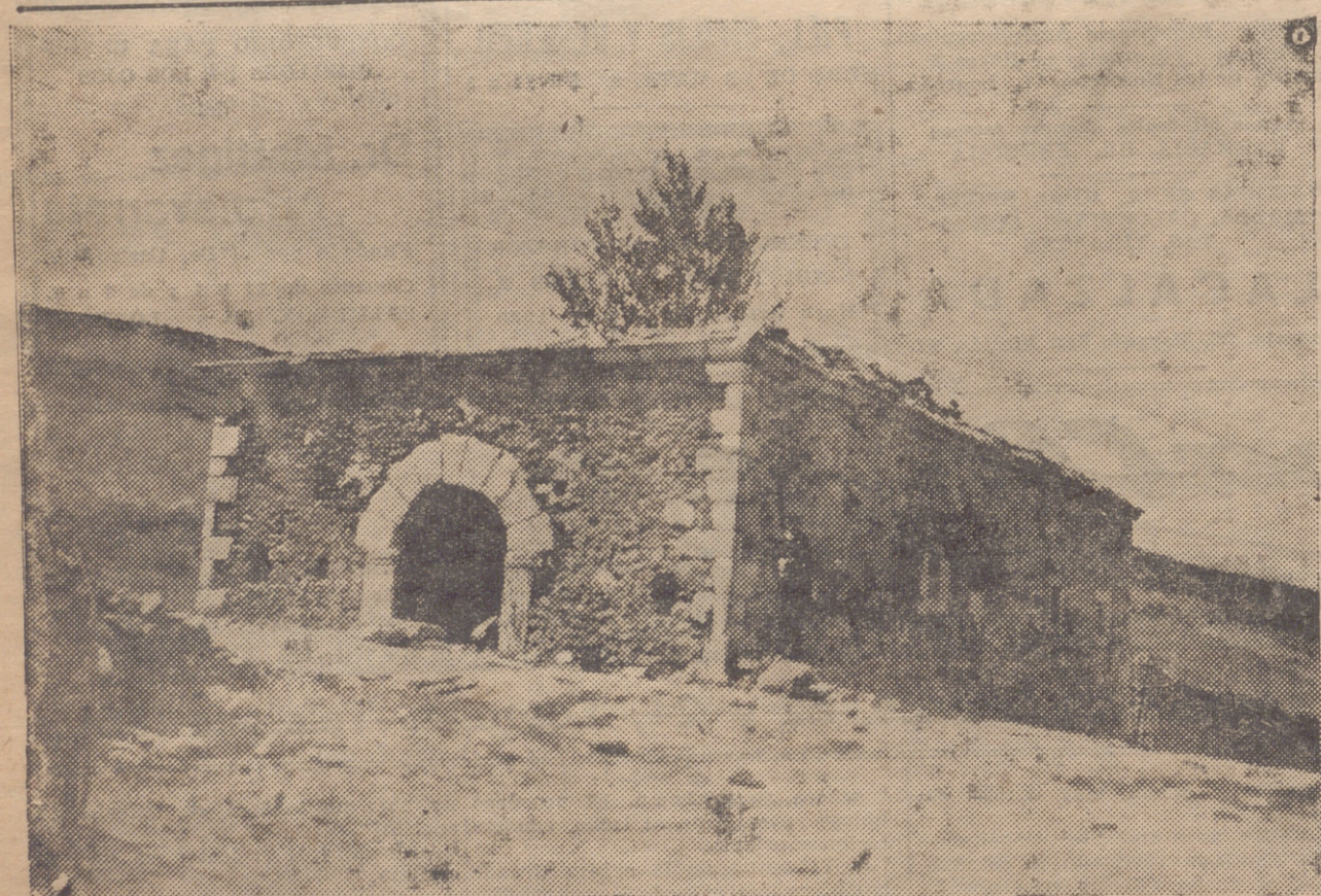
FORTIN ABANDONADO POR LOS MARXISTAS, DESPUES DE PONER LA BANDERA BLANCA, EN EL FRENTE DE SOMOSIERRA