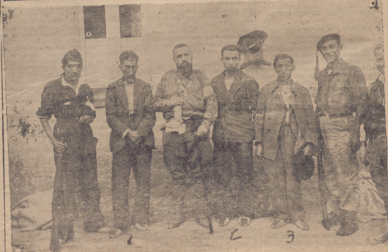
SOMOSIERRA. — TRES DE LOS ULTIMOS PRISIONEROS HECHOS POR NUESTRAS TROPAS EN ROBREGORDO