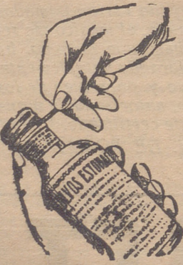
Fig. n.º 3