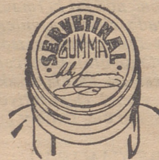
Fig. n.º 2