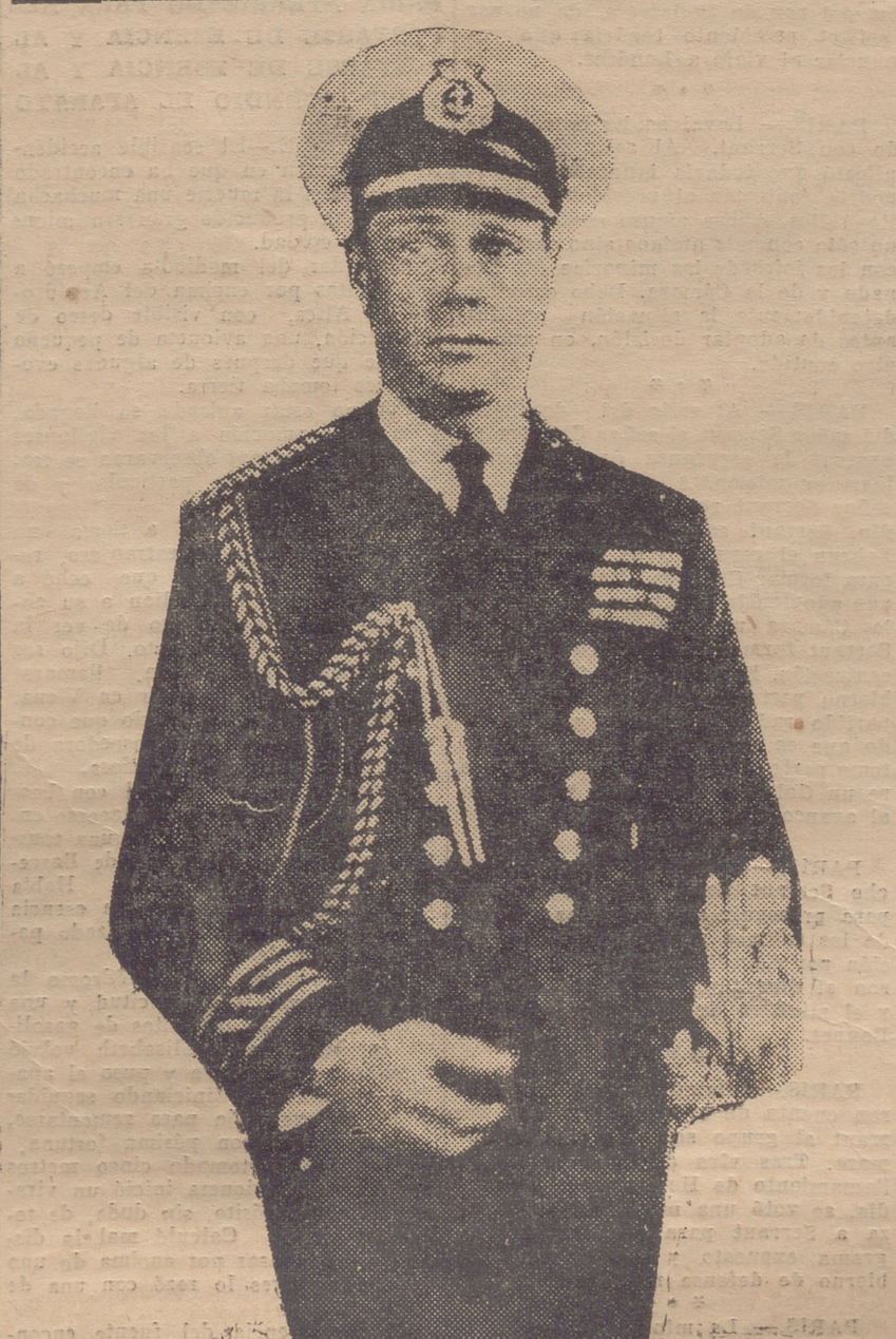
UN RETRATO RECIENTE DEL REY EDUARDO VIII, DE INGLATERRA

Por otra parte, entre el jefe del Gobierno y los monárquicos (Signe al final de la primera columna de la segunda plana)