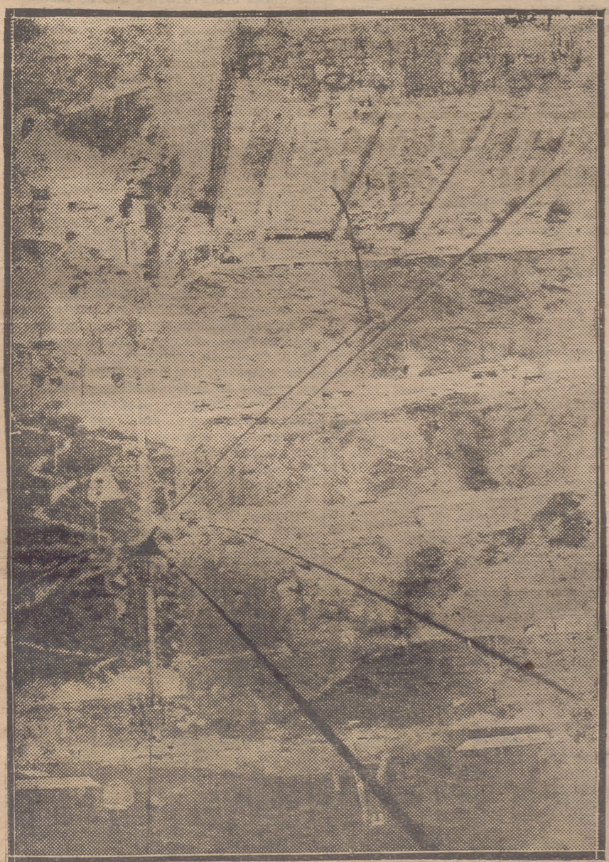
DIQUE EN CONSTRUCCION DEL PANTANO QUE REGULARIZARA EL CAUDAL DEL IREGUA