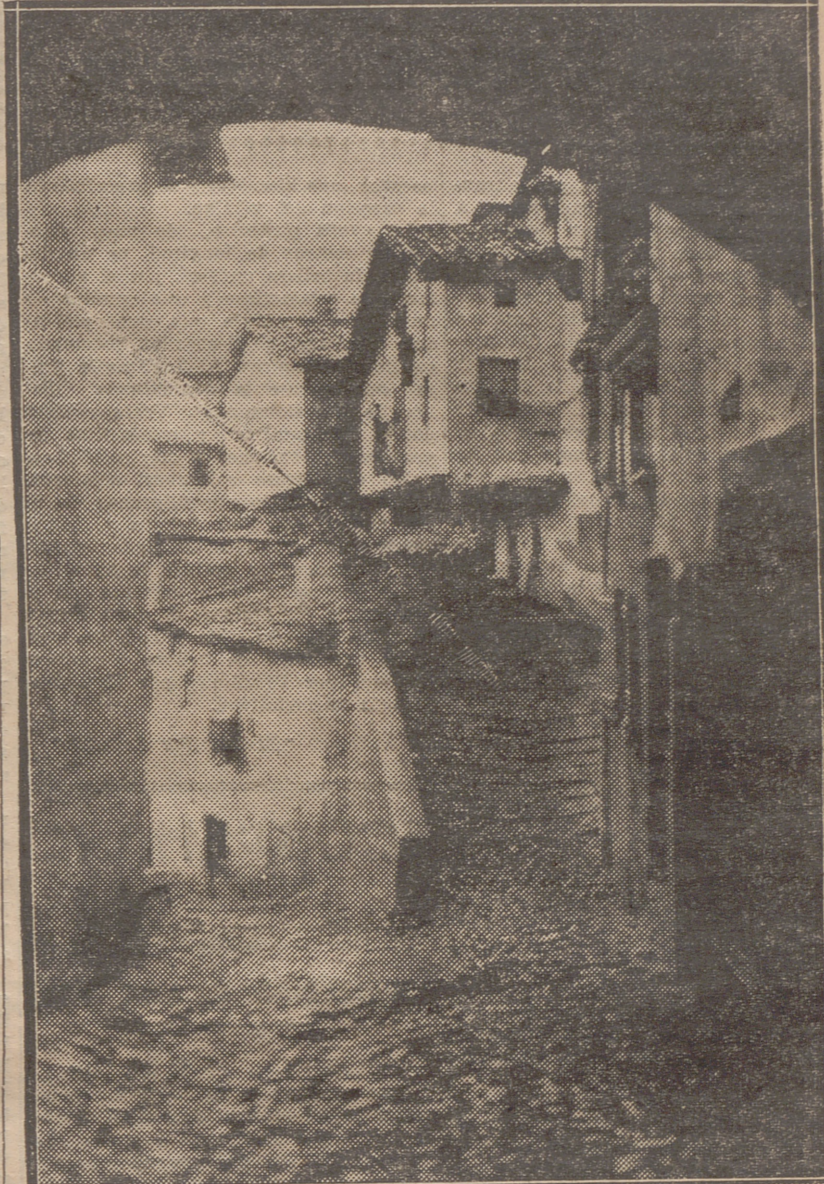
UNA DE LAS CALLES TÍPICAS DE LA VILLA INDUSTRIOSA Y SEÑORA