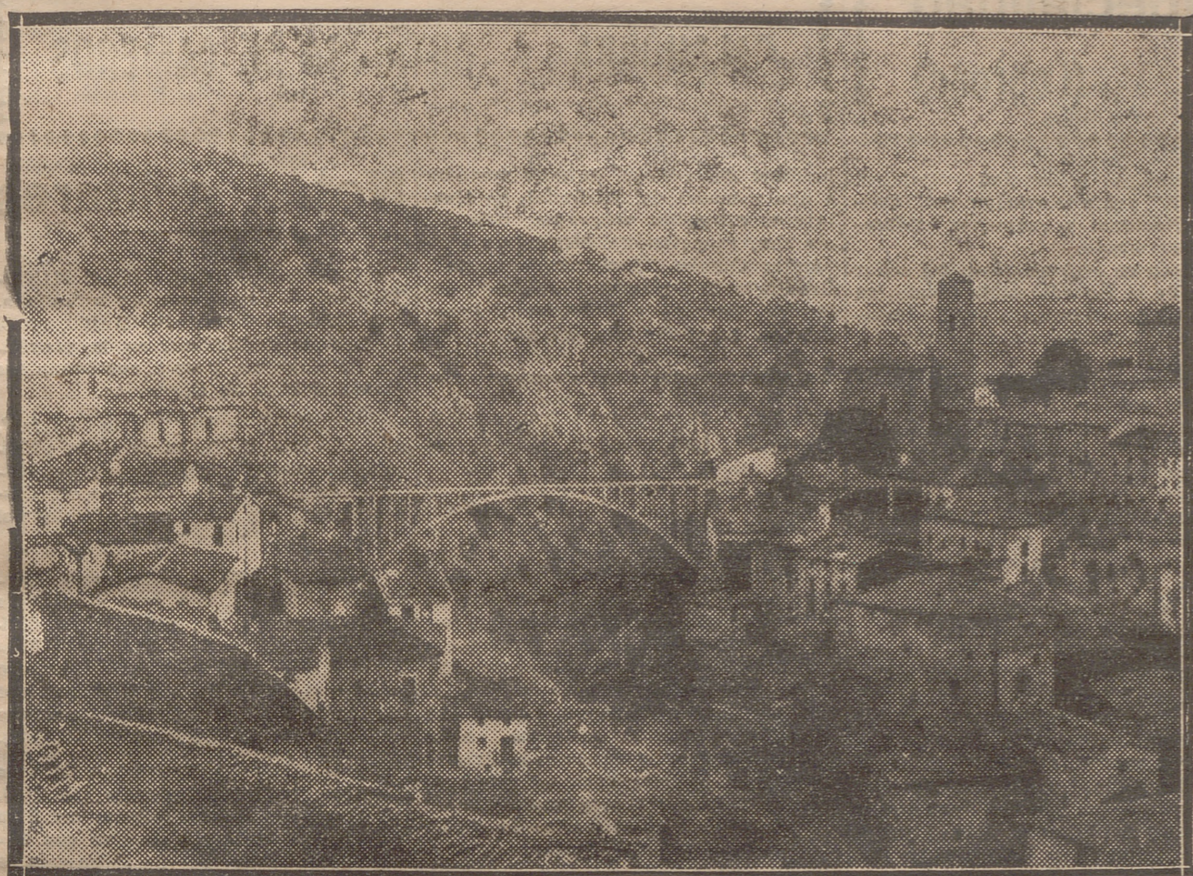
EL GIGANTESCO PUEBLO DE CEMENTO QUE, SALVANDO UN ABISMO DE UN CENTENAR DE METROS, DA COMUNICACION A LOS DOS BARRIOS

El tipismo camerano.-Los benefactores de la villa.-Su actividad industrial.-Las obras del Pantano