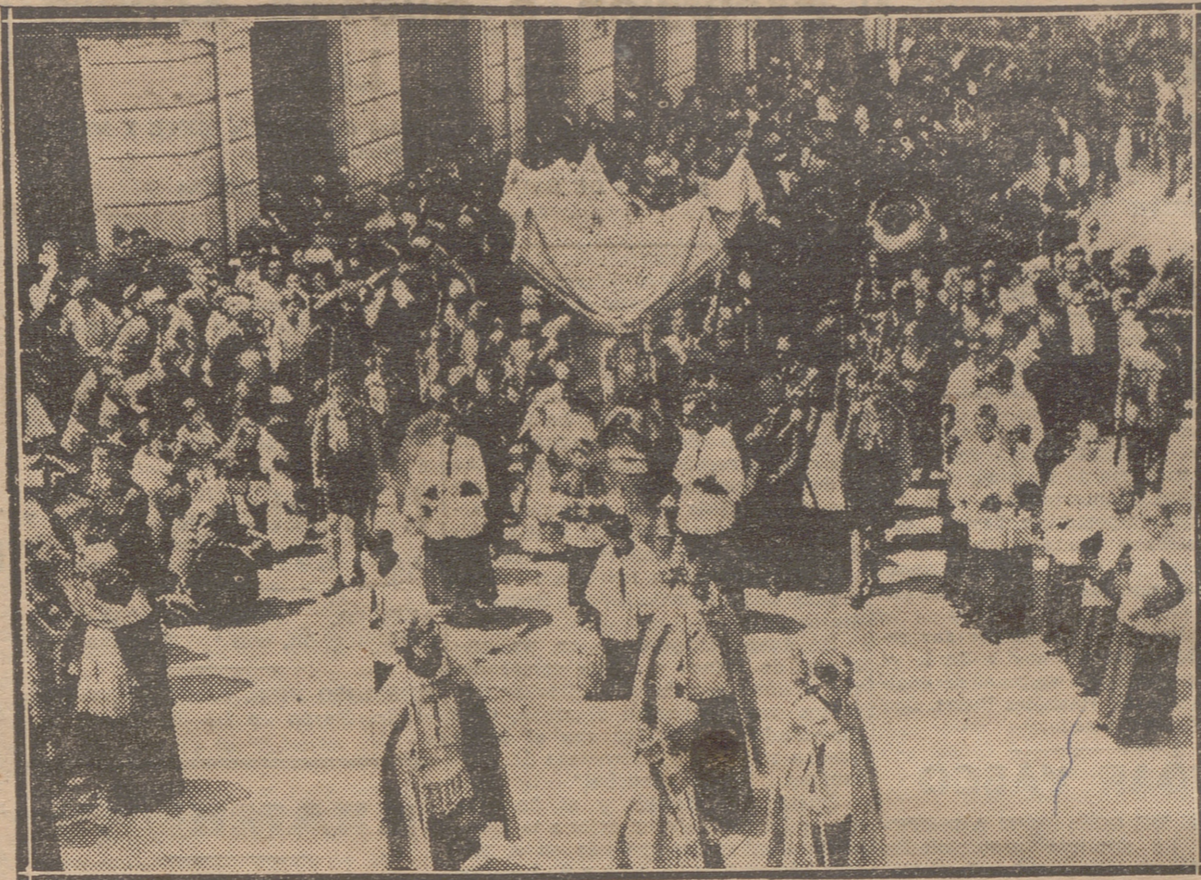
DE LA PROCESION DEL CORPUS EN LOGROÑO.—EL SEÑOR ABAD DE LA COLEGIATA PORTADOR DE LA CUSTODIA, BAJO PALIO, A SU PASO POR FRENTE A LA CASA CONSISTORIAL

Después de recordar a sus oyentes los últimos puntos del acuerdo anglo-alemán, el primer lord del Almirantazgo termina diciendo: "Tenemos la firme esperanza de que a consecuencia de este acuerdo podremos entablar nuevas conversa-