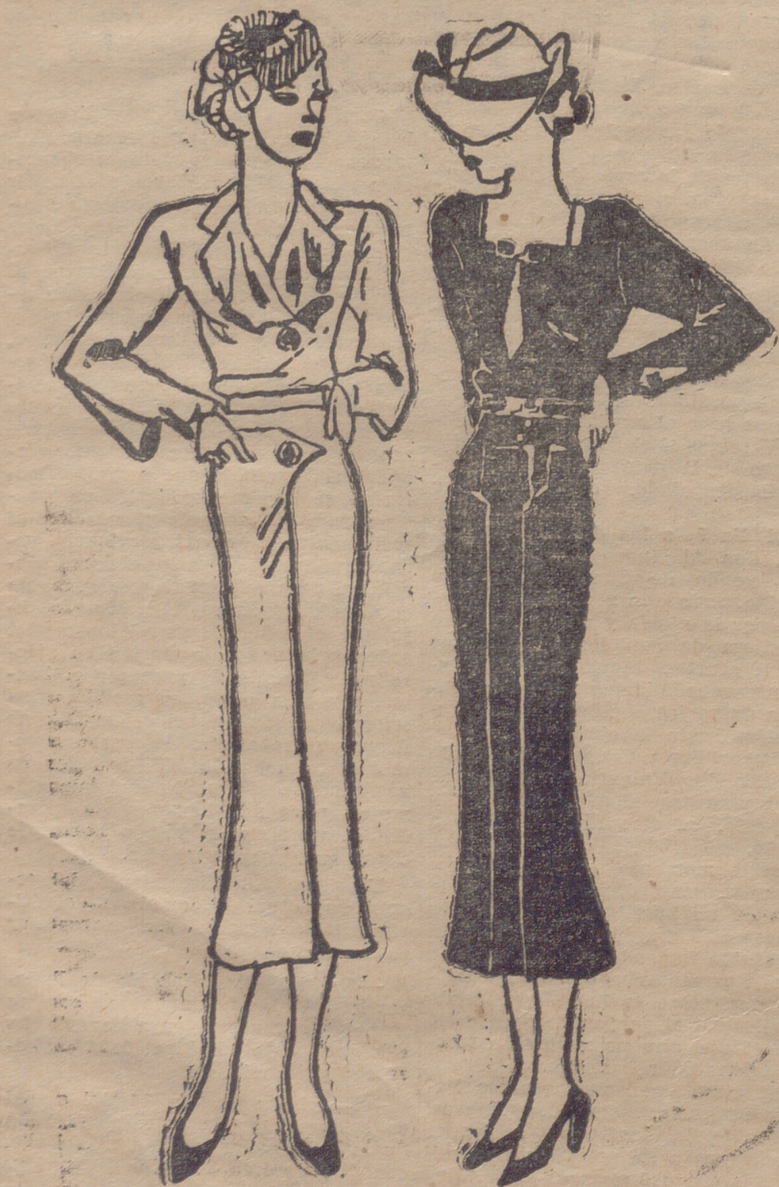
Un original traje sastre y un elegante vestido de lana, con adornos de piqué blanco.

La amenidad y el ingenio son los dos mayores alicientes de la conversación, sobre todo en nosotras, para lo cual hace falta algunas dotes especiales y cierta cultura general, por supuesto, no meramente la recibida