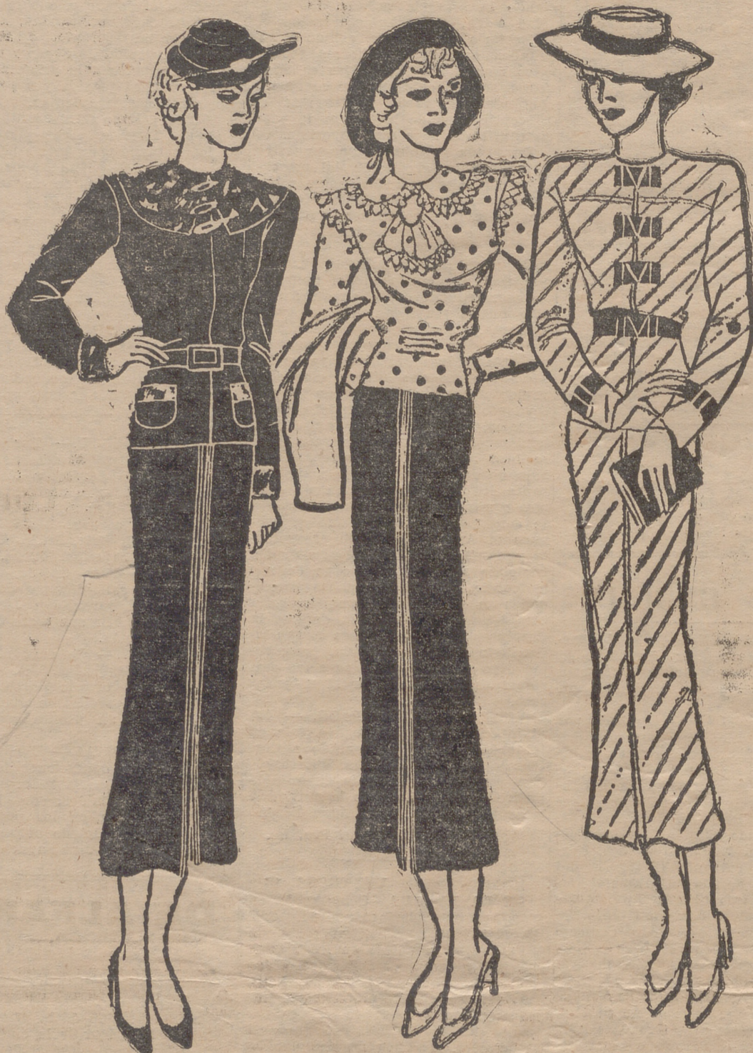
Traje sastre de lana gris con rayas verdes. El cierre de la chaqueta, así como los adornos, son de cuero verde. — Bonita blusa de crepé blanco lamé oro, que puede usarse con la falda del modelo que pasamos a describir. — Traje sastre de lana negra. Cuello y puños de "breitschwanz" negro. Botones dorados. Falda ensanchada por pliegues.