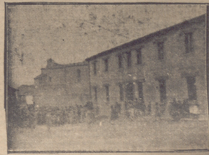
DESCUBRIMIENTO DE LA PLAZA QUE DA NOMBRE A LA PLAZA DE DOÑA PANTALEONA MELON, PLAZA COLOCADA EN EL EDIFICIO PARA ESCUELAS DONADO AL PUEBLO POR DICHA SEÑORA