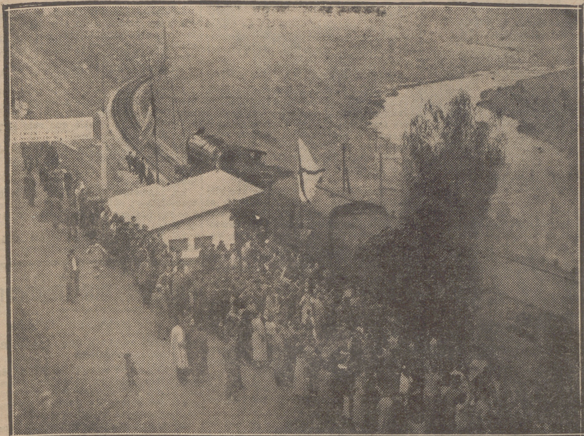
PARADA DEL PRIMER TREN EN EL APEADERO DE EL CORTIJO. EL VECINDARIO RECIBE CON ENTUSIASMO, MUSICA Y COHETES, A LAS AUTORIDADES E INVITADOS.