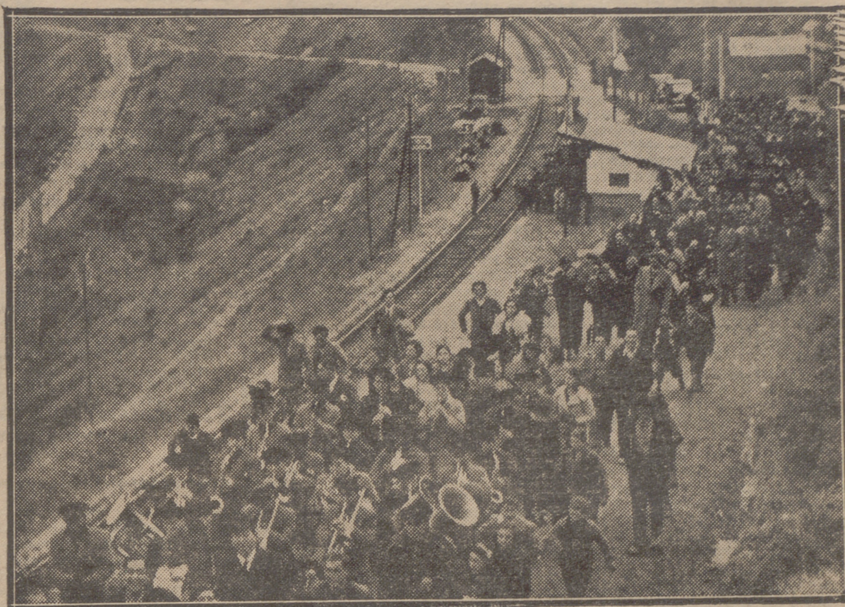
MANIFESTACION INTEGRADA POR AUTORIDADES, INVITADOS Y VECINOS DE EL CORTIJO, DIRIGIDA AL PUEBLO DESPUES DE INAUGURAR EL APEADERO