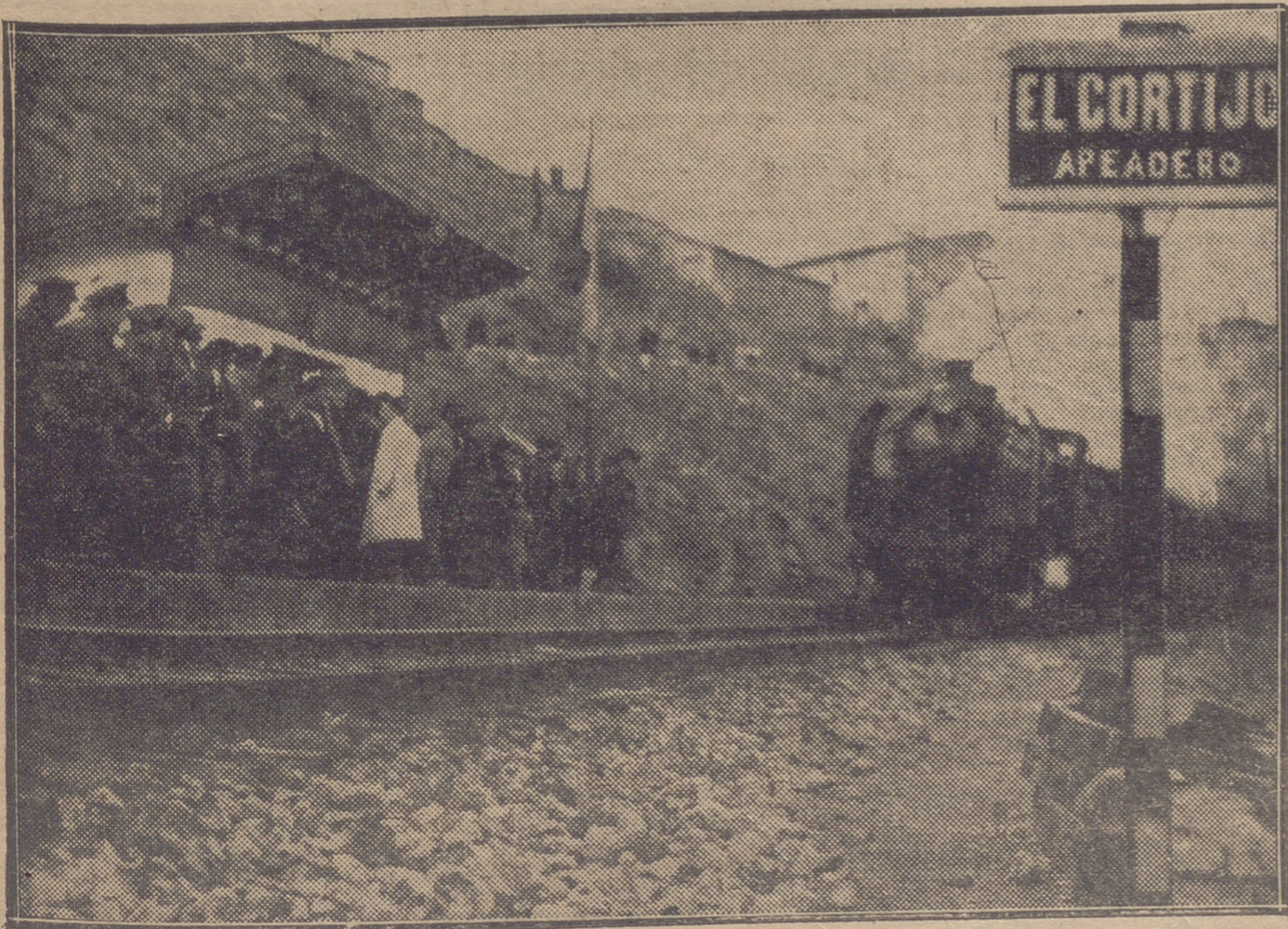
PASO DEL RAPIDO, MOMENTOS ANTES DE LA INAUGURACION DEL APEADERO