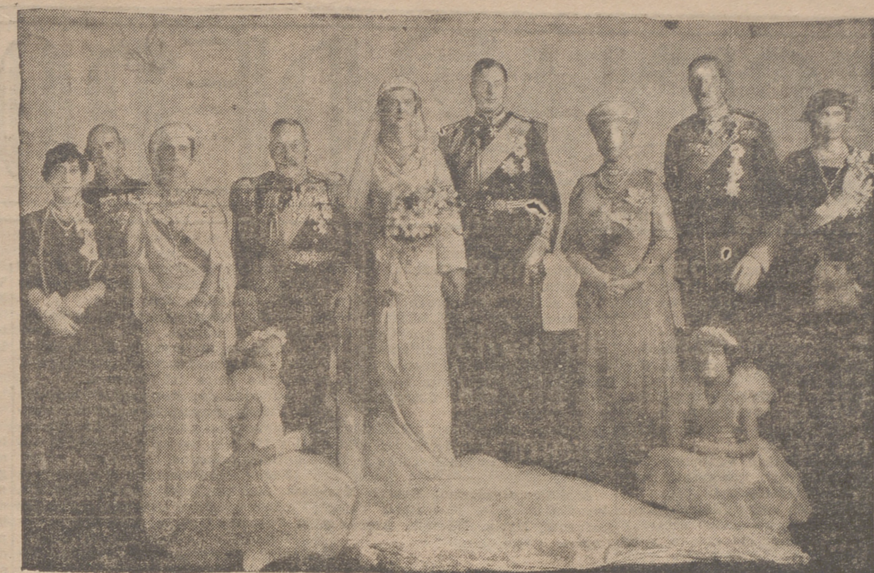
Grupo fotográfico obtenido en el Palacio de Buckingham de Londres después de la ceremonia de la boda de la princesa Marina de Grecia y el príncipe Jorge de Inglaterra. De izquierda a derecha: La reina de Noruega, el príncipe y la princesa Nicolás de Grecia, padres de la novia, el rey de Inglaterra, los contrayentes, la reina de Inglaterra y el rey y la reina de Dinamarca. De rodillas, las dos damas de honor más jóvenes de la novia.