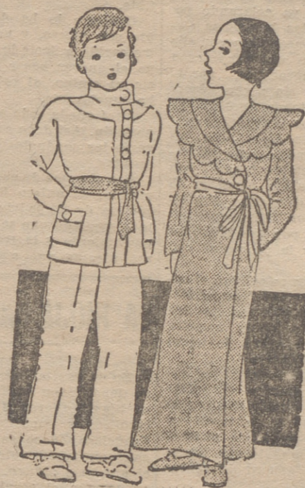
Pijama para niño, de franela azul pastel. Se atocha al lado y está adornado con botones gruesos. El cinturón es de satén, del mismo tono. — Robe de chambre de franela rosa, adornada con un ancho cuello formando ondas.

grandes festejos mundanos donde no llegan los ecos agoreros de la crisis, y que son escarapate a las bellezas más codiciadas y a las innovaciones de la moda, se están viendo ahora los primeros modelos de trajes de la temporada que comienza. En los modelos que nosotras hemos visto en esas reuniones del "gran mundo", observamos las mismas líneas generales que han imperado en los trajes femeninos durante las recientes jornadas veraniegas: silueta fina y alargada, talle apenas perceptible, falda larga, preferencia para los modelossastre y colores firmes y de una solatonalidad.