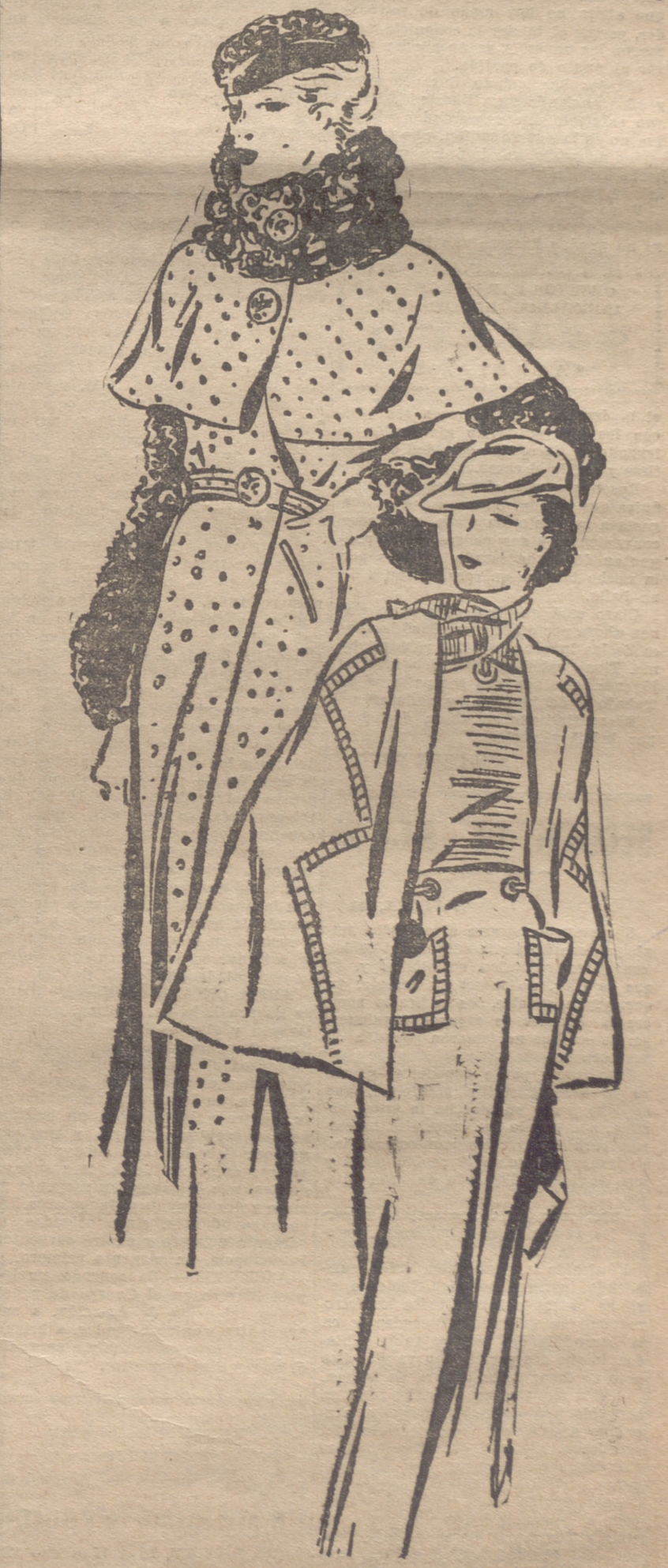
Vestido de "schouklap" verde, adornado con astracán negro y con mangas de piel. — Conjunto matutino, en angorina verde, con corbata y blusa de jersey fantasía del mismo tono.