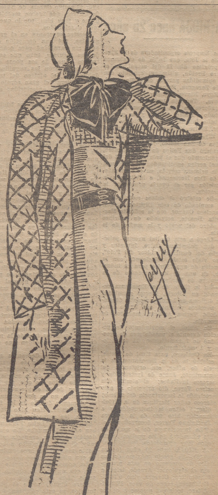
Abriego tres cuartos, de lanilla a cuadros castaños, sobre fondo beige; sobre un vestido de jersey muy fino color beige.