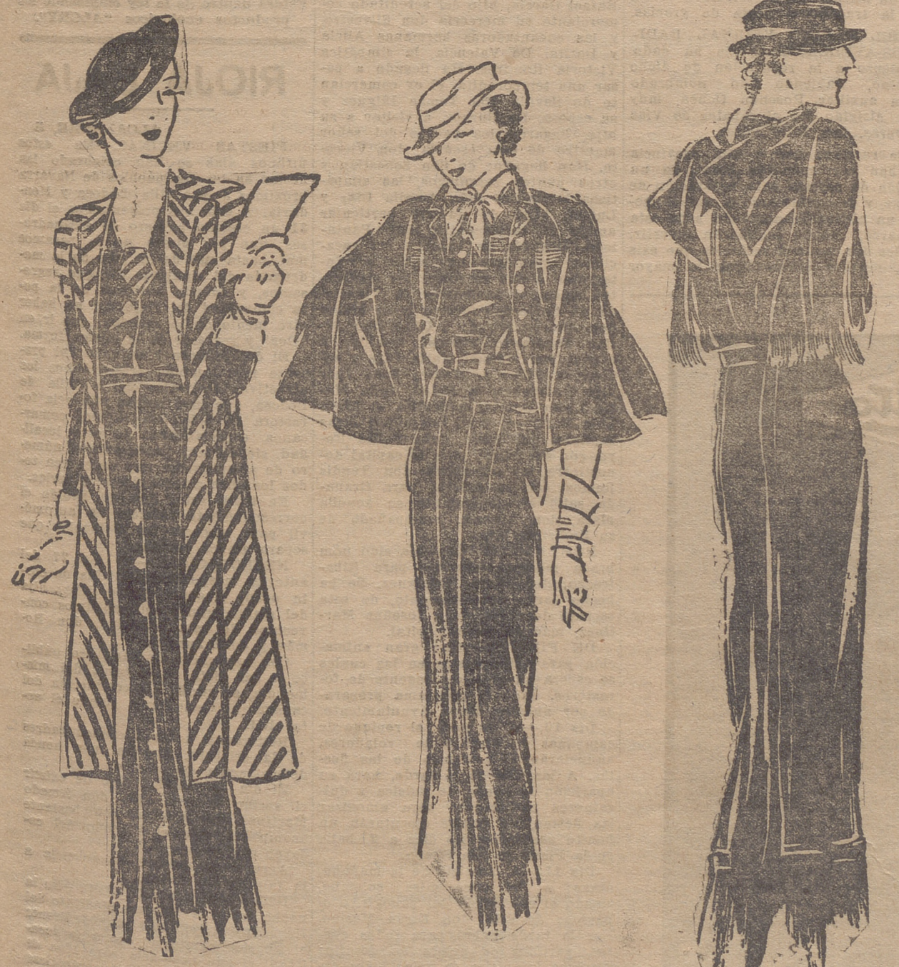
Conjunto de viaje en kasha azul marino y verde almendra.

A la Venus de Milo no es la piedad LIMPIEZA QUIMICA Tintorería MASIP