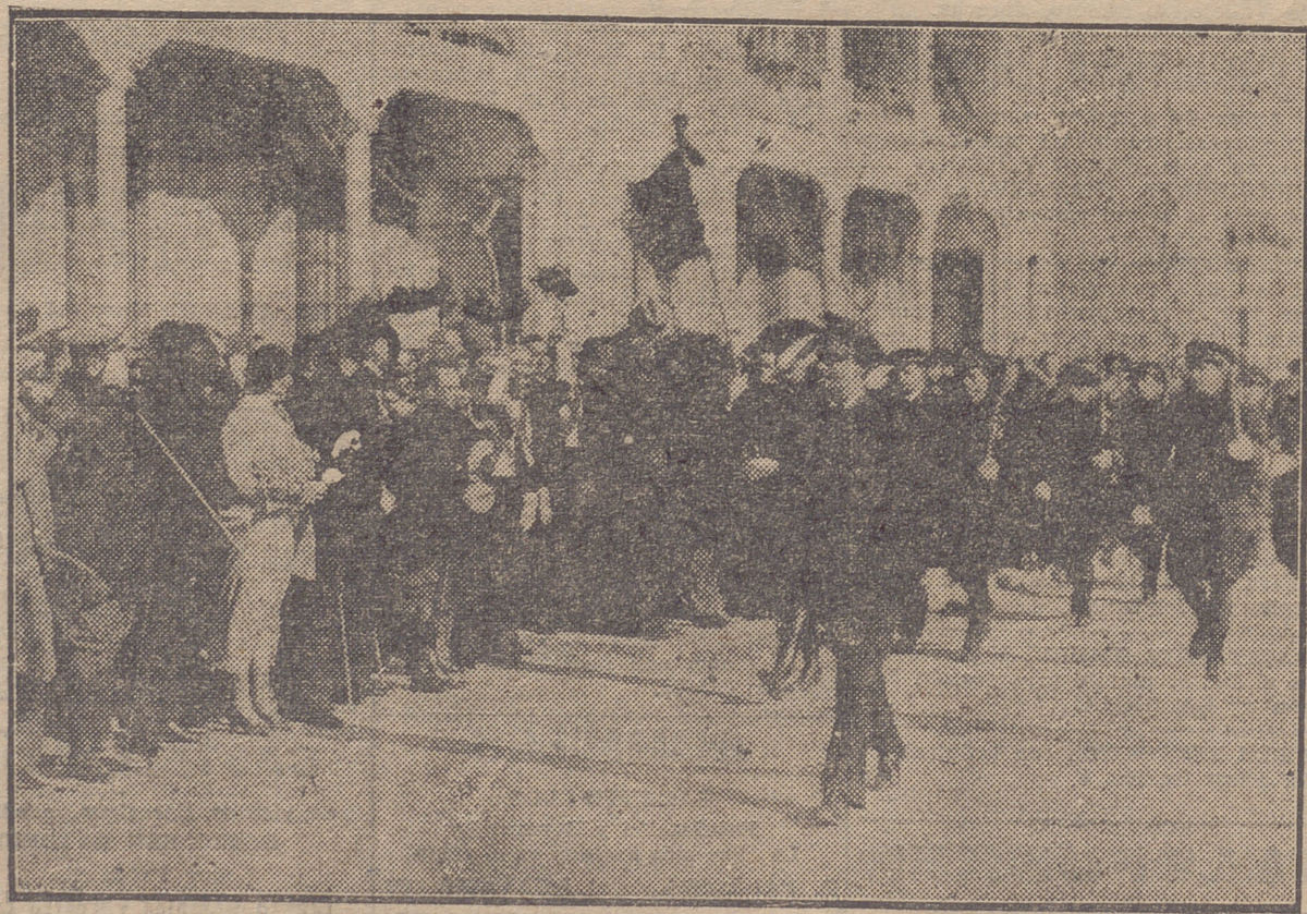
LAS FUERZAS DEL AERODROMO DE AGONCILLO DESFILANDO CON LA ENSEÑA QUE LES FUE DONADA

Once de Junio, 18, entresuelo. OCULISTA. — EX-ALUMNO DE LAS CLINICAS DE BURDEOS Y PAU