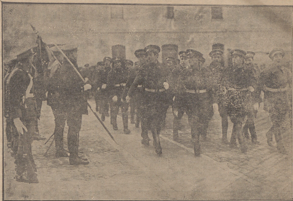
LOS RECLUTAS DE ARTILLERIA DESFILANDO ANTE LA ENSEÑA DE LA PATRIA