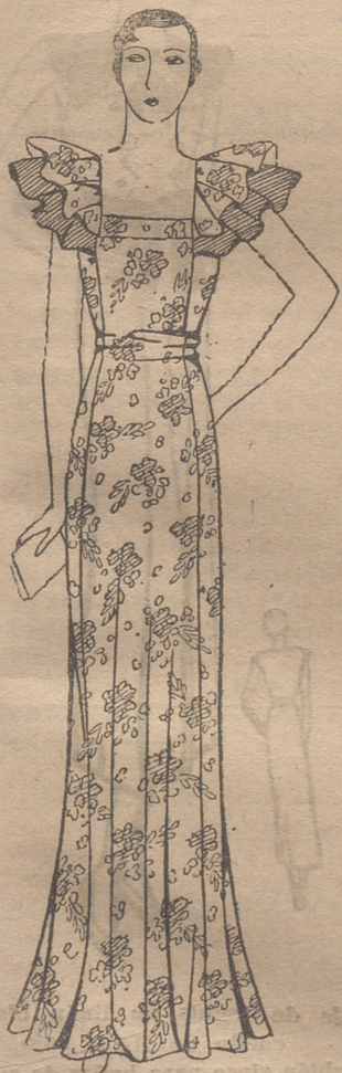
Vestido de noche en organdí de seda blanco, con impresiones de ramitos de flores coral, verde, azul y amarillo

Hemos tomado nota esta semana de los vestidos siguientes. Un traje sencillo de piqué blanco adornado con chaleco a rayas rojo y amarillo; echarpe y adorno del sombrero con esta