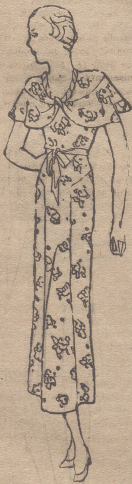
Vestido de crepón de china, estampado, gris pálido y flores rojas

En Londres—dicen—hay humo, polvo. El sudor, el humo y el polvo dan como resultado una mancha negra. Las muchachas londinenses salen por la mañana de sus casas orgullosas de exhibir unas atrevidas piernas