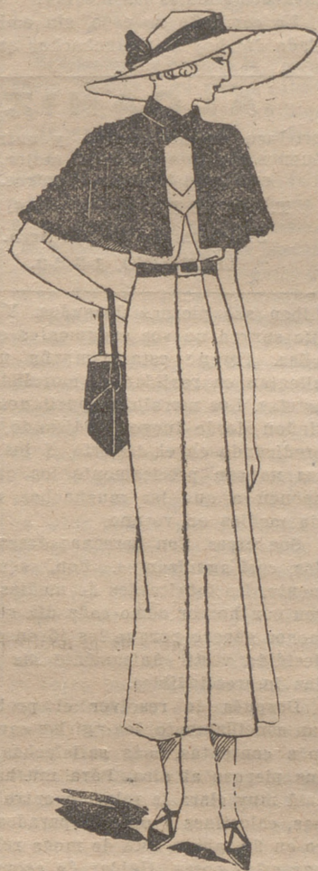
Sobre un vestido de playa, de algodón "armuré" blanco, una capita de algodón rojo, adornado con un cuello cruzado y terminado por dos patas abotonadas

CENTRAL.—REPUBLICA, 22.—(PORTALES) SUCURSAL.—HERMANOS MOROY, 10 (PLAZA DE ABASTOS) CONFECCIONES Y GENEROS DE PUNTO DE TODAS CLASES. EQUIPOS DE NOVIAS Y CANASTILLAS PARA RECIENTOS NACIDOS, VESTIDITOS PARA NIÑOS ESPECIALIDAD EN LOS ENCARGOS