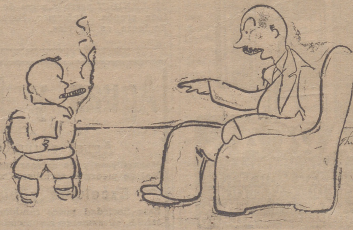
EL PADRE.—¿Qué alegría le darías a papá si te quitases de ese vicio! (De New Yorker.)

Los comentarios que se hacen alfeador de esta sustitución, son muy variados, no saliendo muy bien librada la seriedad de la empresa, a la que Bartolomé, en su deseo de actuar en la plaza de Alfaro, por tener en esta numerosas amistades, envió (según nos afirman amigos de dicho novillero) el contrato en blanco a la empresa explotadora de nuestra plaza de toros. P. Jiménez.