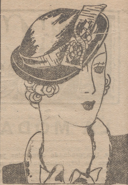
Sombrero de paja marrón oscura, levantado por detrás. Adornado con cinta cruzada adelante con florecitas marrones y hojas verdes

CREMAS PARA TOMAR BAÑOS DE SOL CAMOMILAS RUBIO PLATINO Y DORADO Perfumería VIUDA DE ELIZONDO