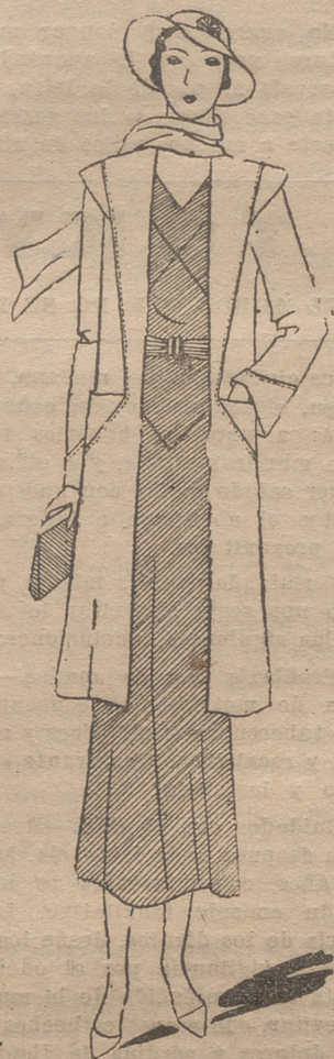
Abrijo de lanilla blanca, sobre un vestido de "shantung" amarillo

Se hacen los abrigos para viaje de forma muy acampanada, con cuellos y echarpes de lanilla tibia y confortable. Al salir de verano convendrá a