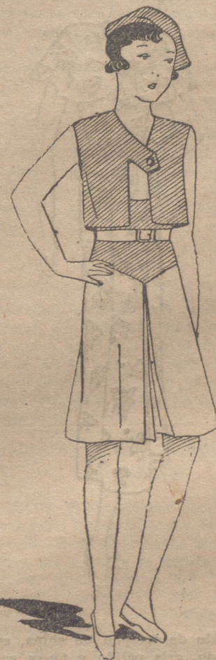
Bolero de piqué amarillo, sobre un vestido de piqué amarillo y blanco. Cinturón blanco

Por lo expuesto, fácilmente se comprenderá que conviene aumentar la cantidad de tomate que se consume en casa para aprovechar sus valiosos beneficios. Estamos ahora en la época y se puede comer crudo, como ensalada, sólo o acompañado con lechuga, pepino, cebolla o patatas. Deliciosa y muy alimenticia resulta una sopa que se prepara pasando los tomates por un tamiz; con todo su jugo se pone a cocer, agregando ajo y especias a gusto, aceite frito, pan tostado y huevos. Además es muy conocida la salsa de tomate que puede aplicarse a infinidad de platos de carne, pescado o huevos, cuya preparación conoce la generalidad de las personas. Un plato elegante y agradable, es el tomate relleno. Se eligen tomates muy sanos no excesivamente maduros, se abren por la parte de arriba y se extrae parte del interior para rellenarlos con carne picada muy fina, miga de pan y perejil, todo esto frito antes en manteca; después de rellenos se meten al horno bien caliente para cocer.