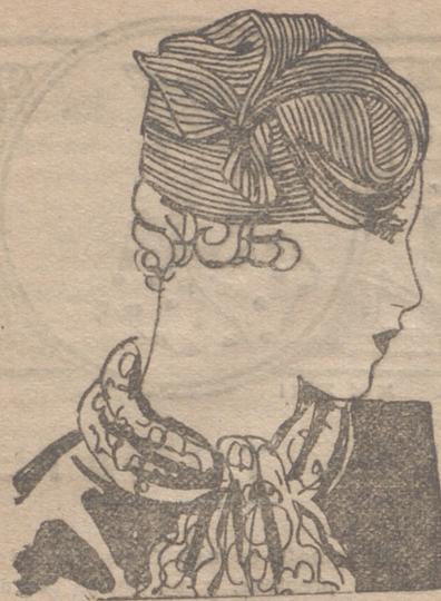
Toca hecha de paja "charteuse", cosida a mano