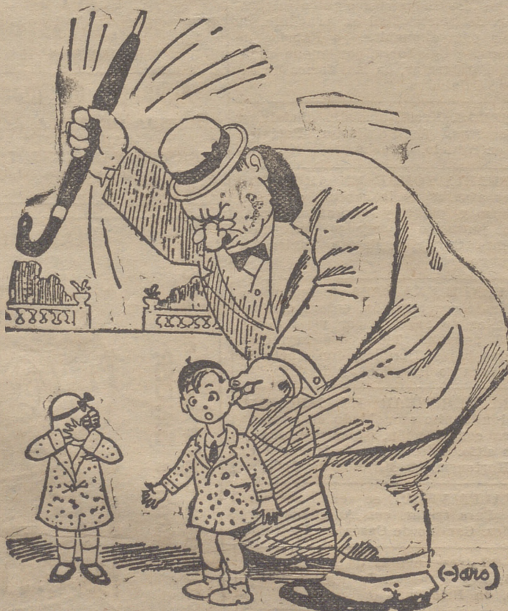
—¿Quién te ha enseñado a tirar de las orejas a tu hermana? ¿Me has visto tú alguna vez tirar de las orejas a alguien?

Cánticos, reserva y bendición con el Santísimo, terminándose con la Salve y la Adoración de la reliquia. Día 16, a las ocho, Misa de Comunidad general; a las diez la Mayor, con asistencia del cabildo.