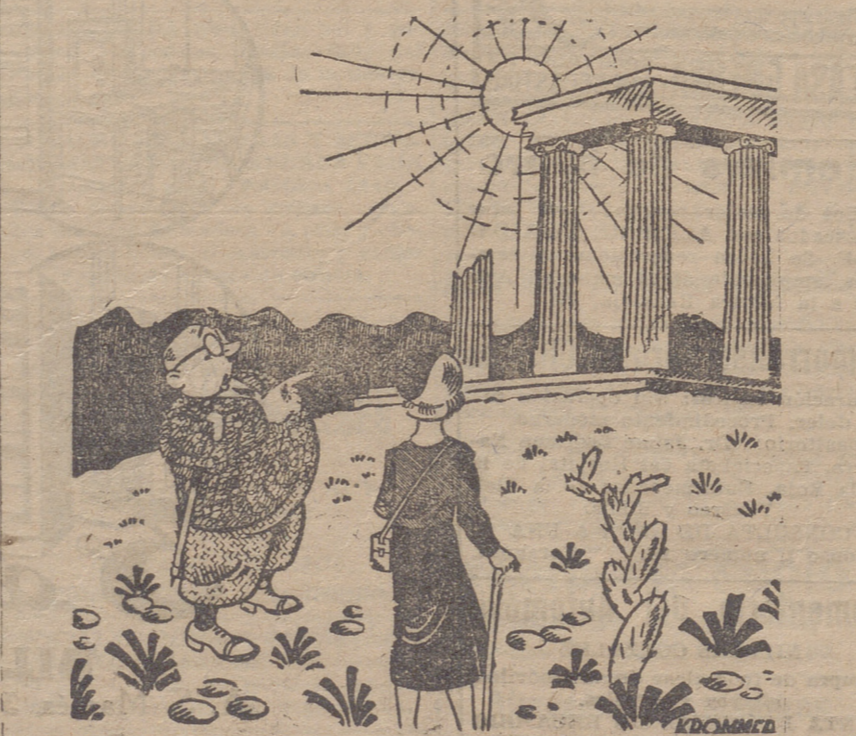
—Siempre han tenido los hombres la manía de construir sin tener bastante dinero para terminar las obras.

Médico de la Casa de Socorro Bretón Herreros. 19, 2.º 10 a 1 y 3 a 8 GARGANTA.—NARIZ Y OÍDOS TELEFONO 1788