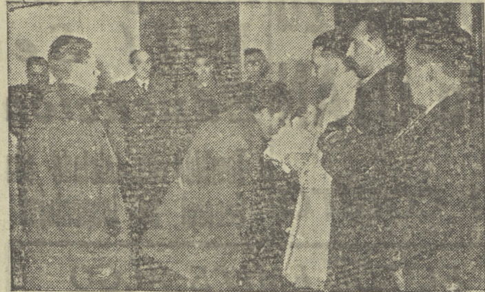
Un momento de los actos celebrados en la Prisión Central con motivo de las fiestas de Navidad

Se han celebrado con gran esplendor en este Establecimiento Penitenciario varios actos religiosos y profanos, con motivo de las fiestas navideñas.