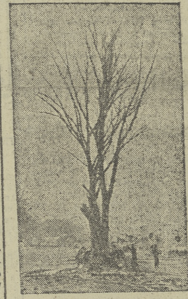
En el tramo primero del Paseo de la Quinta se está procediendo al derribo de los árboles secos, continuando la labor interrumpida al iniciarse el verano.