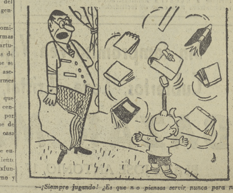
Siempre jugando! Es que no piensas servir, nunca para nada!