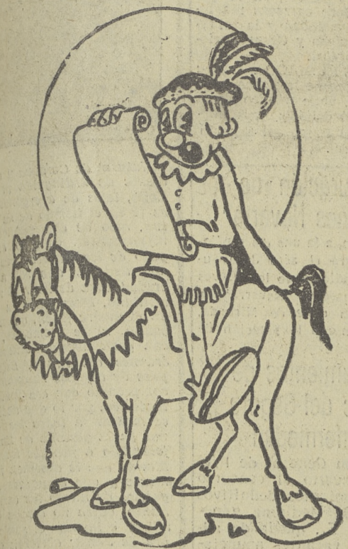
CON LA LECTURA DEL PREGON Y LA TIPICA CABALGATA