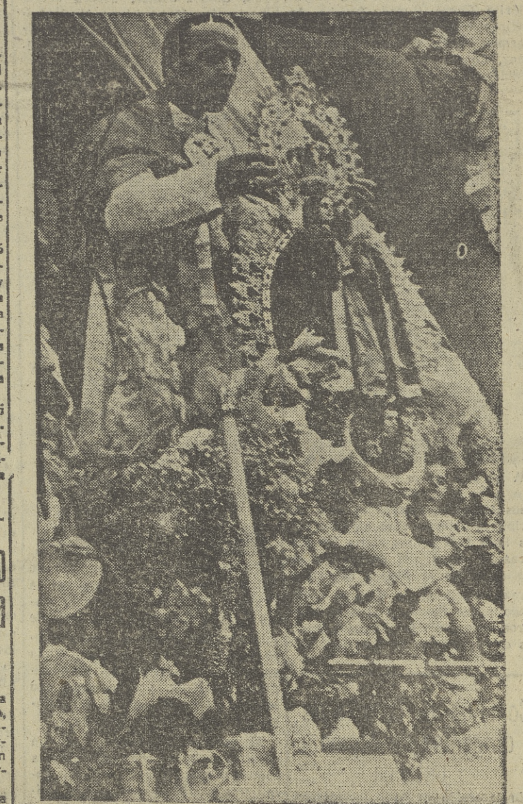
El Nuncio de Su Santidad, monseñor Hilcebrando Antoniutti, corona solemnemente a la imagen de la Purísima en Villalpando, pueblo que ya en 1466 hizo voto de defender la Pureza de María, adelantándose a todos los de la Cristiandad. A las solemnes ceremonias, celebradas el domingo, asistieron altas jerarquías de la Iglesia y del Estado, así como más de quince mil romeros.