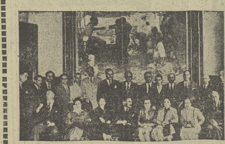
Un grupo de secretarios de primera categoría de Ayuntamientos y Diputaciones, que realizan en el Instituto de Estudios de Administración Local un curso para diplomados, estuvo el domingo en Burgos. En la "foto", de Villafraña, aparecen durante su visita al Palacio provincial.